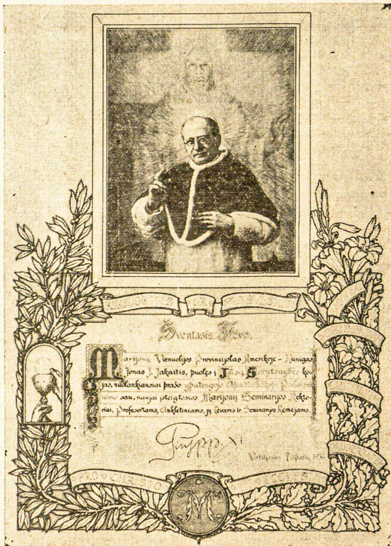
SV. TĖVAS LAIMINA MARIJONŲ MOKSLO ĮSTAIGŲ RĖMĖJUS IR KATALIKIŠKOS SPAUDOS PLATINTOJUS

(Paskaita skaityta per Marijonų Rėmėjų Chicagos Apskrities seimą)