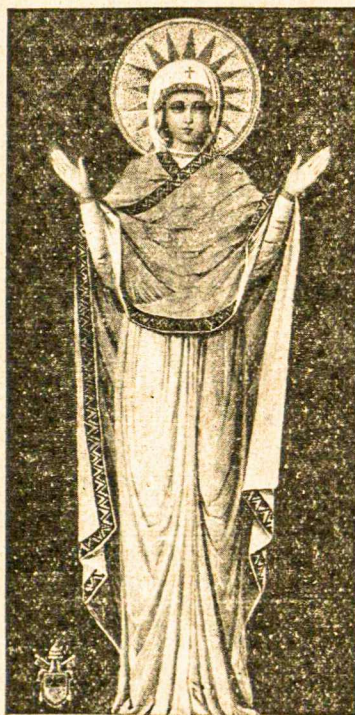
Popiečiaus Pijaus XI Dovana Marijonams

Tuos įvairius darbus atlieka broliukai vienuoliai ir kunigai vienuoliai. Darbais pasidalina sulig palinkimų, gabumų ir įgyto mokslo.