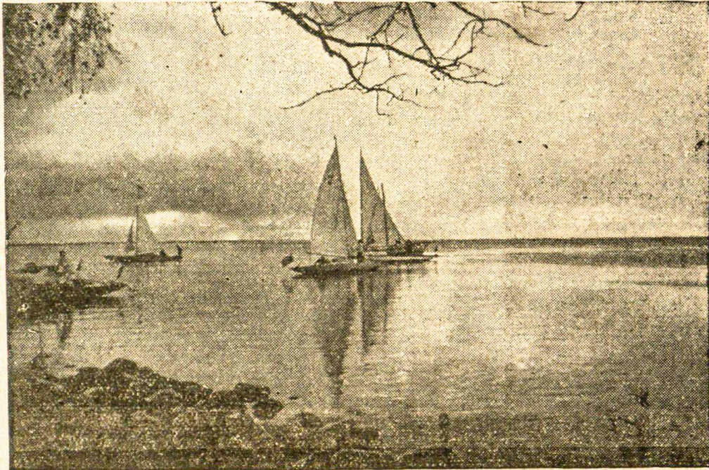
Gražus Lietuvos pajūrio vaizdas