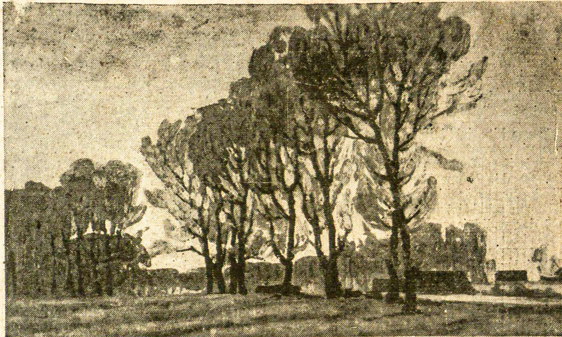
Lietuvių dailininko A. Varno Lietuvos žiemos peizažas