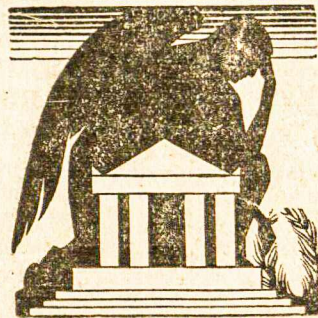
MARIJONŲ RĖMĖJŲ DR-JOS GARBĖS NARĖ

Kadangi, kai kuriose kolonijose susilpnėjo Marijonų Rėmėjų kuopų veikla, tai seimas pageidauja, kad apskričio valdyba parūpintų asmenis, kurie laukytų ir gaivintų silpnas kuopas ir organizuotų naujas.