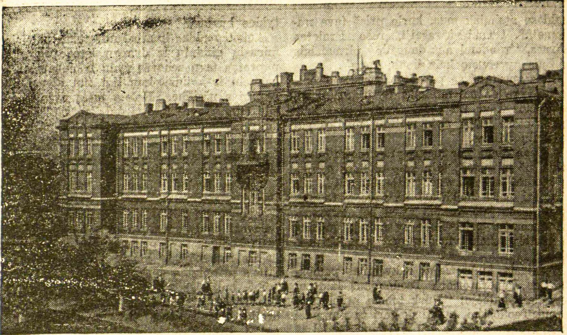
Saulės Draugijos rūmai. — Kaune ant Žaliojo Kalno yra pastatydinti iš amerikiečių surinktų aukų Saulės Draugijos rūmai. Šiuose rūmuose dabar yra iš Amerikos atvažiavusių vienuolių kazimieriečių mergaičių gimnazija ir bendrabutis.

prie tokios tarp dangaus ir pragaro vietos buvimo. Kadangi „niekas suteptas negali įeiti į dangų,“ todėl siela, kuri apleidžia šį pasaulį atleistiną nuodėme susitepus, arba laikinos bausmės dar neišpildžius, negali įžengti į dangų. Bet ji nėra taip baisiai prasikaltus, kad pelnytų amžiną pragaro bausmę; bausmę, kuri būtų žymiai didesnė už kaltę. O yra labai galimas daiktas, kad daugelis žmonių miršta atleistinomis nuodėmėmis susitepe. Jie nėra verti tuojau žengti į dangų, tačiau, kita vertus, nebūtų teisinga nugrumsti juos į pragarą. Taip mūsų protas rodo. Ta vieta, kurios mūsų protas taip reikalauja, yra Skaistykla, kur tų sielų sutepimai nuvalomi ir sielos prirengiamos įžengimui į neapsakomas dangaus linksmes jūjų Sutvėrėjo ir Viešpaties aki-vaizdoje.