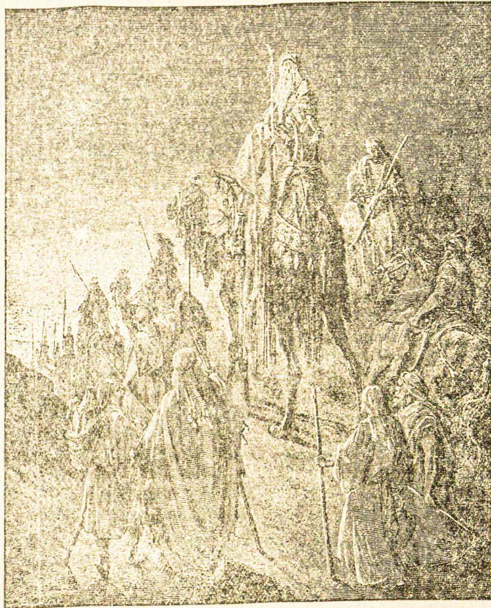
Rytų šalies trijų karalių kelionė.