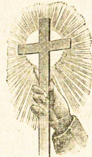
Et Tenuo. Et Tenuo