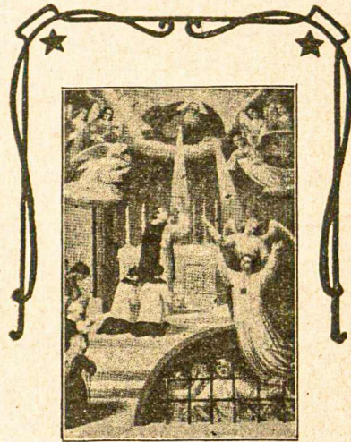
Prašan melstis už mane visų, kurie mane pažino ir visų, kurie mane mylėjo. — Sv. Eftemas.

Nuo krikščionybės pradžios laikų katalikai nepaprastai gerbė mirusiųjų kapus ir iki mūsų dienų kapai laikomi šventa vieta, puošiami ir gražiai užlaikomi.