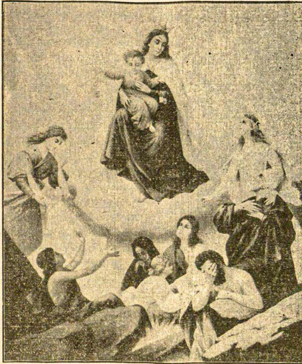
“Pasigailėkite mane, pasigailėkite mane, bent jūs, mano prieteliai, nes Viešpaties ranka išliko mane.” (Jobo 19, 20).