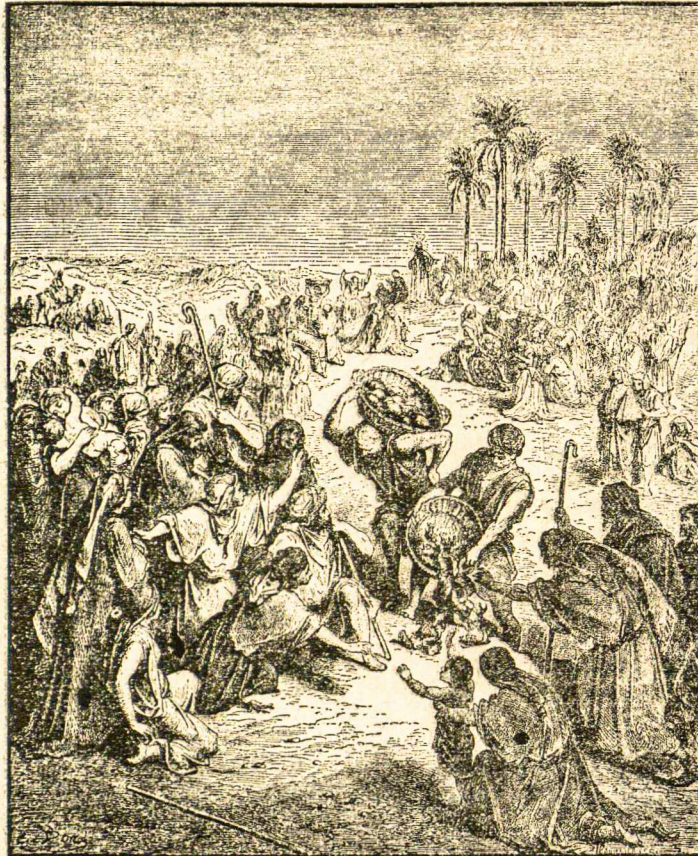
Stebūklings duonos padauginimas.