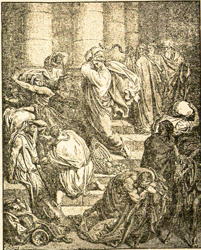
V. Jėzus išvaro iš bažnyčios pirklius.