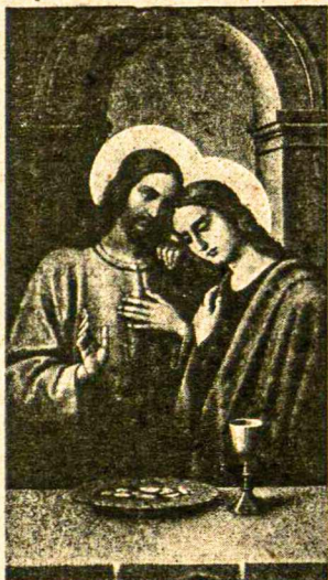
“Vaikeliai mylėkitės kits kitą”

Bendroji Liepos mėnesiui 1934 Intencija, kurią paskyrė Šventasis Tėvas Pijus XI.