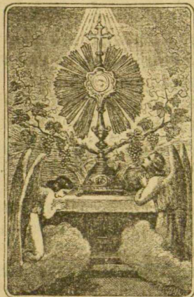
Tikinčiųjų Komunija per Mišias.

Viską apmąstantis ir kilniausias Šv. Mišių objektas pilniausiai reiškiasi kunigo ir žmonių Šv. Komunijoje. Aukojimo veiksmas baigiasi su Šventuoju Pokyliu, kuriame Auka yra imama, kai po valgis. Tame Šventame Pokylyje išūninti Dievo vaikai sėdasi kartu su Tikruoju Sūnum, Kurs juos padarė įpėdiniais į Jo karalystę; dėl to jie savinasi Jo Kančios nuopelnus, apturėdami pažadą ir nujautimą tos laimės ir garbės, kuri jų laukia. Eucharistiniame Pokylyje galime vaizduoti mūsų Išganytoją, sėdintį mūsų tarpe, kaip mūsų Tėvą; Bažnyčią, kaip mūsų Motiną; ir visus tikinčiuosius, kaip vaikus, kurie meilinguoju pasitikėjimu atsilanko priimtų Gyvenimo Duonos.