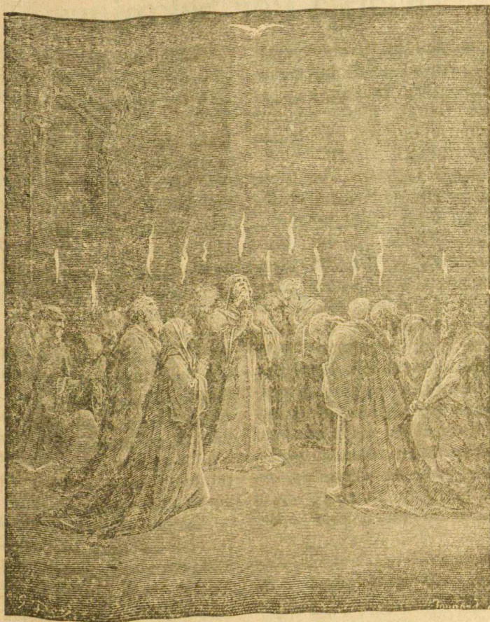
Prisiuntimas Dvasios Šventos apaštalam

Dešimtoje dienoje po šeštinių, devintoje valandoje, nužengē šv. Dvasia ant apaštalu.