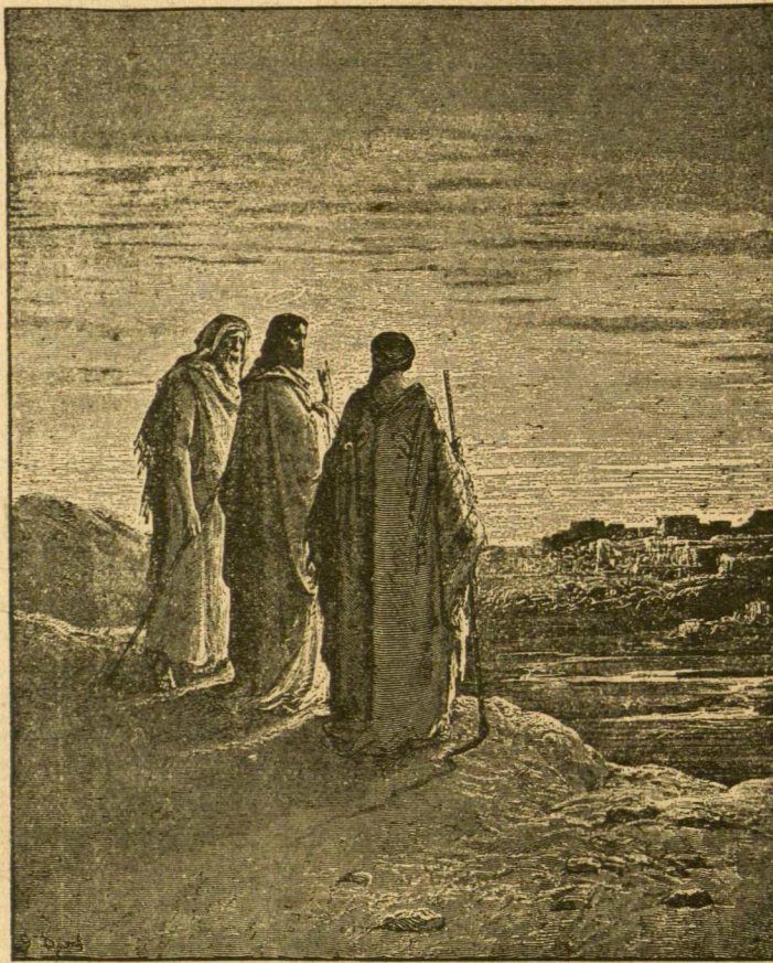
Jezus su mokiniais keliauja į Emaus.

Šv. Mišiose antrā Velykų dienā iš šv. Luko Evangelijos 24, 13—35 skaitome apie Jēzaus du mokiniu šī apskatinējimā: