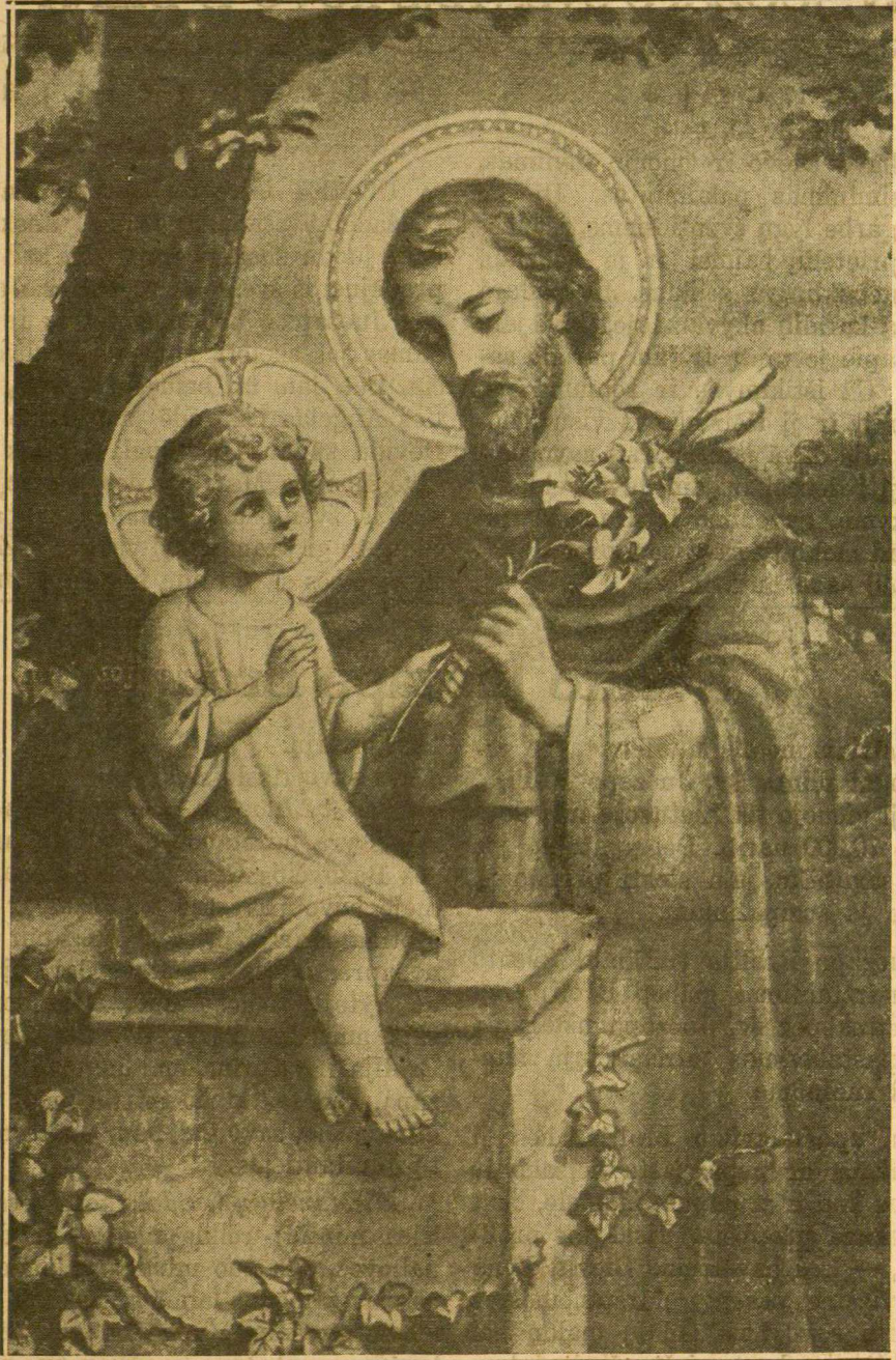
Šv. Juozapas Visos Bažnyčios 'Globėjas