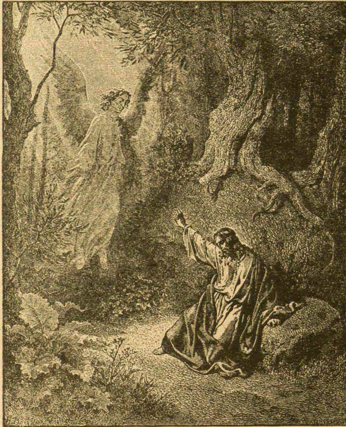
Aniolas ramina Iŕganytoja.