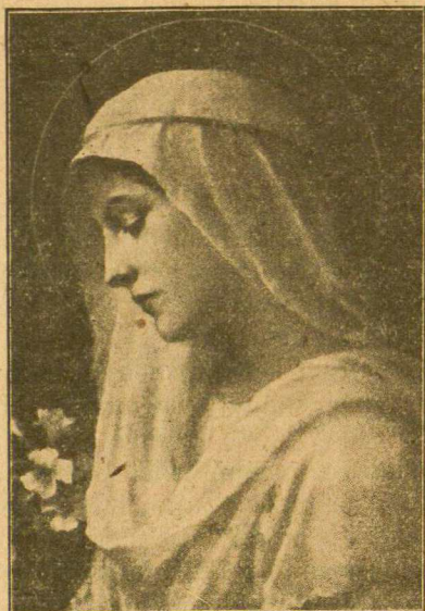
Švč. Mergelė Marija

siems tėvams buvo pranešta apie DIEVO Motiną. Laikui bėgant, patriarkai ir pranašai, kalbėdami apie Mesiją, kartu pranašaudavo ir apie Jojo būsiančiąją Motiną. Čia priminsiu keletą tokių pranašysčių.