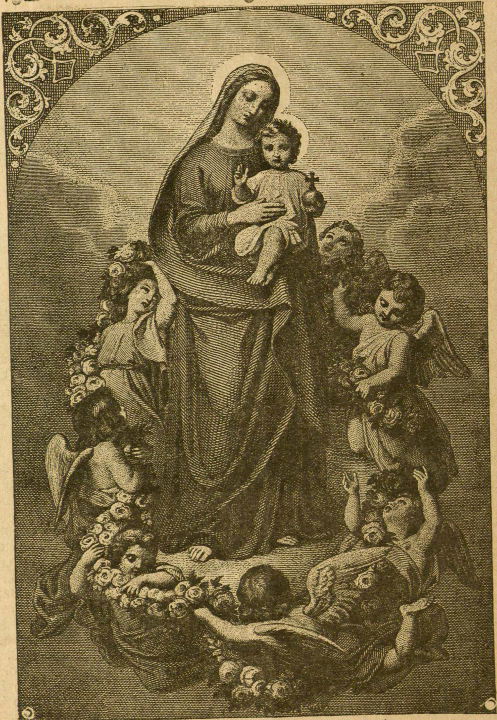
Angelų Karaliene, melski už mus!