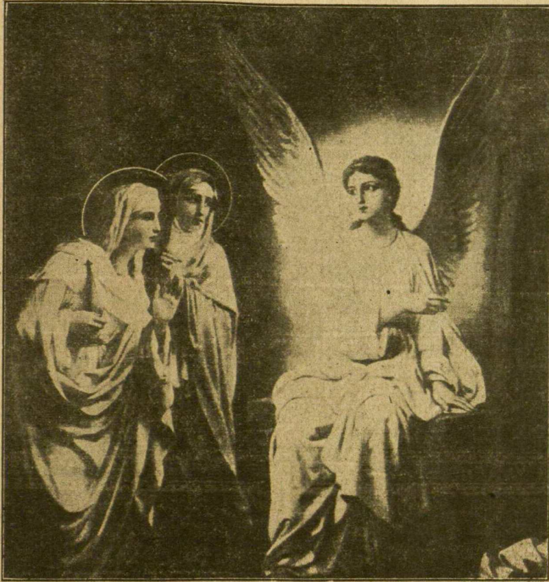
„Jis atsikėlė, Jo nėra čionai; štai vieta, kame Jį buvo padėję.“

ma žmogui tapti Kristumi ir pelnyti po mirties garbingą prisikėlimą ir palaimintąjį kūną, panašų į Jėzaus Kristaus prisikėlusio kūną.