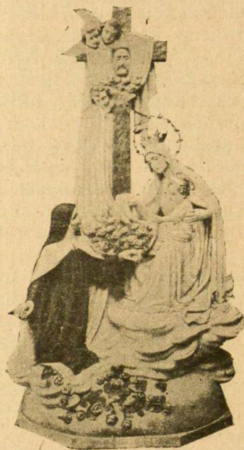
Šv. Teresė Vaikelio Jėzaus, mūsų dienų Šventoji, greitai atsiliepia į kiekvieną žmonių šaukimąsi pagalbos.