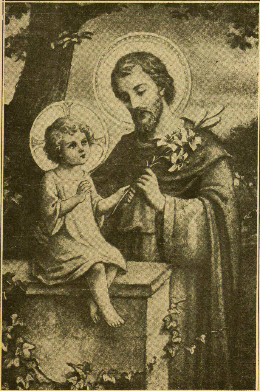
Šv. Juozapai, darbininkų pavyzdys, Melski už mus!