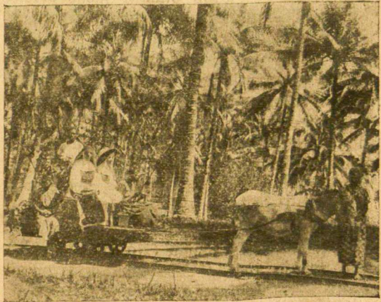
Seserys Misijonierės Afrikos Miškuose.

Čia, Tėve, aš prisiminiau Tavo įspėjimus ir ėmiau šauktis Marijos pagalbos. “O Marija, neleisk man mirti be sakramentų.” Vos spėjau ištarti tuos žodžius, dramblis sustojo mane daužęs ir, lengvai paėmęs mane padėjo ant minkštos žolės. Toliau nežinau, kas su manim atsitiko. Aš atsibudau čia šioje ligoninėje. Čia dabar aš visa kuo aprūpintas. Tikiu, kad Švenčiausioji Motina mane išgelbėjo.”