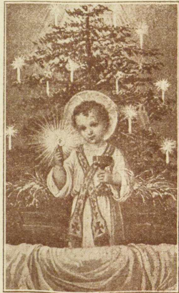
Sveikas Jėzau mažiausias!

Taigi ir aš "Laivo" vardu sveikinu visus skaitytojus "Sveiki Naujųjų Metų sulaukę! Tegul bus pagarbintas Jėzus Kristus jūsų širdyse, mintyse, žodžiuose ir darbuose", o naujųjų metų laimė bus jums užtikrinta!