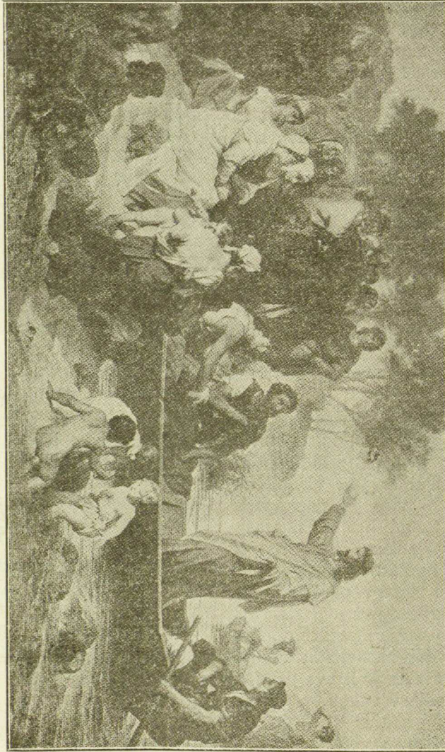
.Ir kikiēnas, kums pēlīka namus, ar broļius, ar seseris, ar tēvā, ar mo- tina... deļīai mano vardo, gaus šinteriopai ir pavēldes amžīnāji ēvchīnā. (Mat. 19, 29).