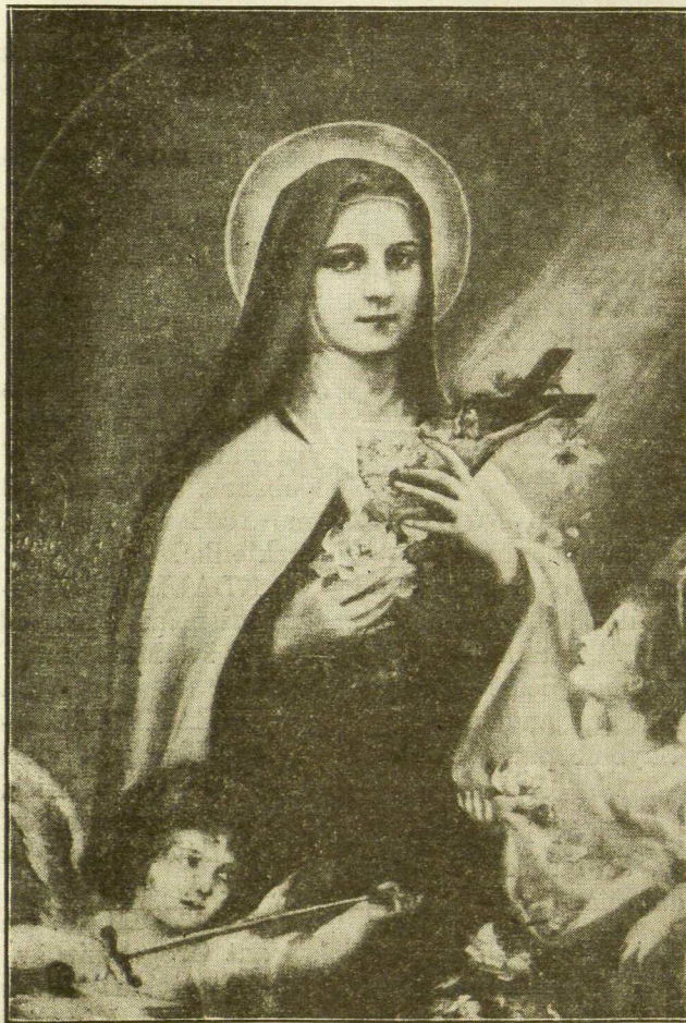
ŠV. TERESE VAIKELIO JĖZAUS, Mažoji Gėlėlė.

Jau yra išėjusi knyga apie josios gyvenimą su pridėtomis Novenomomis ir kitomis maldomis. Kaina 50c. Galima gauti "Draugo" knygyne 2334 So. Oakley Ave., Chicago, Ill.