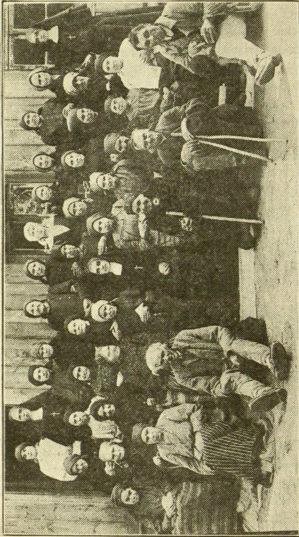
Mariampolės Senelių Prieglauda. Vargd. Sesel. Vien. vedama.