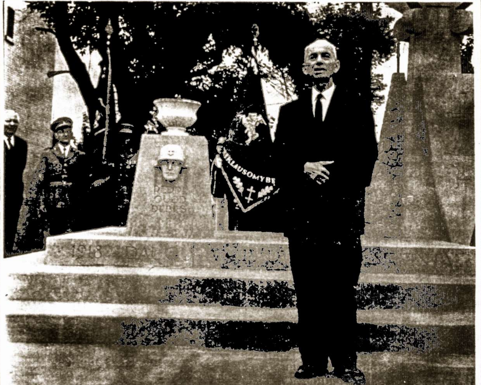
Lietuvos Šaulių Sąjungos Tretyje metinio suvažiavimo proga, dėdant vainiką žuvusiųjų pagerbimui prie paminklo, kalba Šaulių S-gos Garbės Narys, buv. Krašto Saugos Ministeris generolas K. Musteikis. Fone - Čikagos ir Montrelio šaulių vėliavos.

Lietuviškosios tautiškosios individualybės turinio kūrybai, tai nemirštama tautinė dorybė, kurią tiki ir užkietėjęs bažnytinis apolgetas ir liberalus krikščionybės pasekėjas ir tautiniai apsisprendę socialistas. Lietuviškosios tautiškosios individualybės turinio kūrybai, tai nemirštama tautinė dorybė, kurią tiki ir užkietėjęs bažnytinis apolgetas ir liberalus krikščionybės pasekėjas ir tautiniai apsisprendę socialistas. Lietuviškosios tautiškosios individualybės turinio kūrybai, tai nemirštama tautinė dorybė, kurią tiki ir užkietėjęs bažnytinis apolgetas ir liberalus krikščionybės pasekėjas ir tautiniai apsisprendę socialistas.