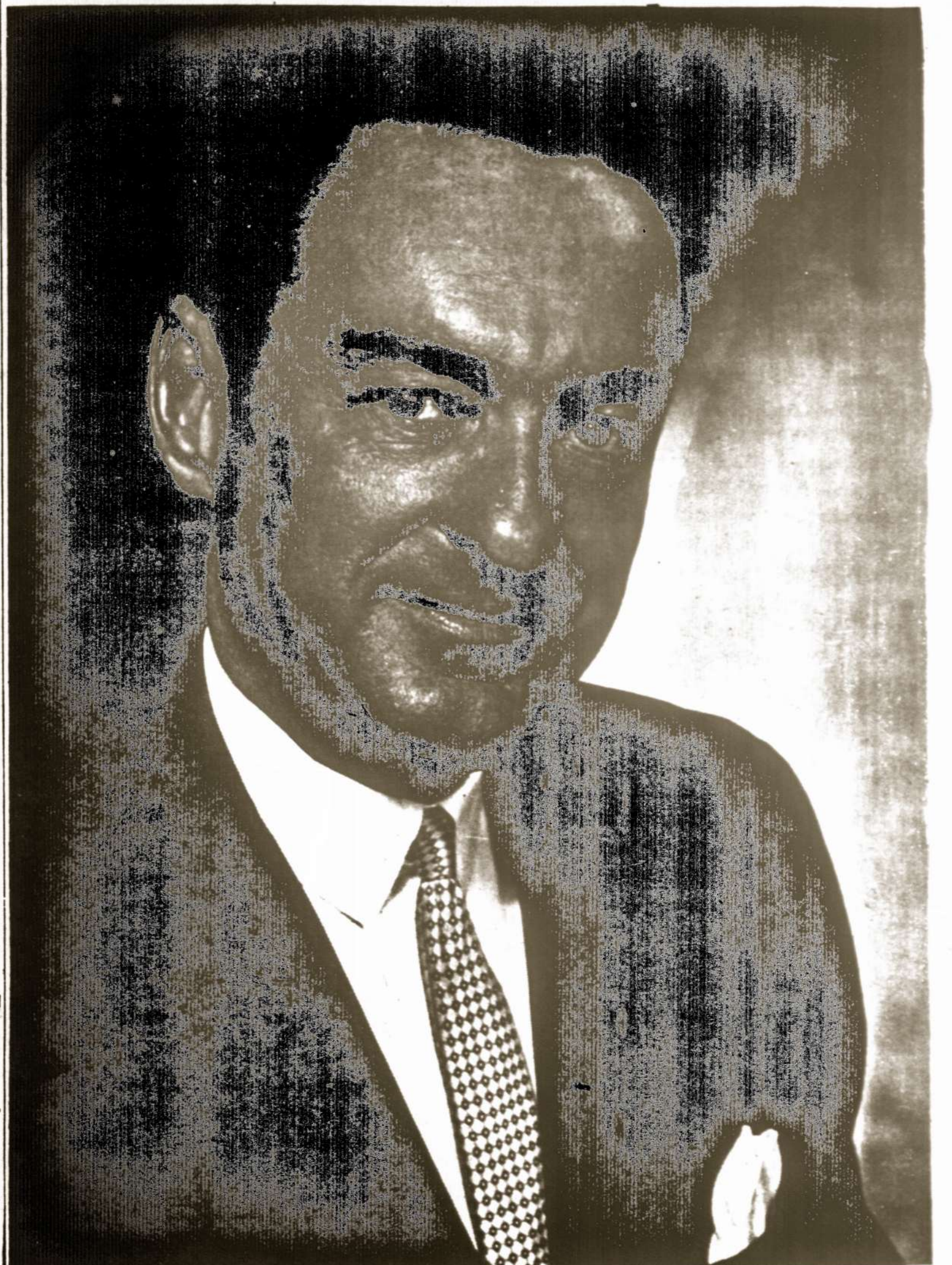
WILLIAM E. MILLER Respublikonų Partijos kandidatas į JAV Viceprezidentus, vienas iš geriausių Amerikoje kalbėtojų