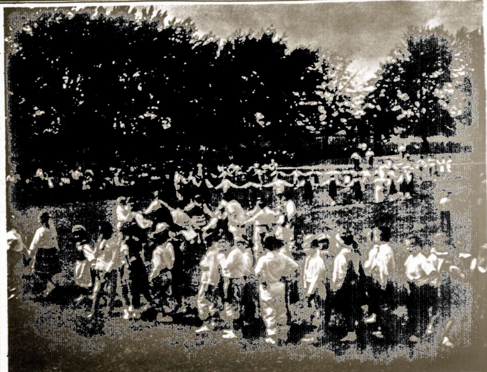
Čikagos K. Donelaičio Lit. Mokyklos jaunesniųjų mokinių grupė moterų šventėje...

tingai, visose tautose yra civilizacijos ir kultūros elektras, paskata. Neapgaukinėkime savęs ir nejuokinkime kitų, demonstruodami lietuvišką nusistatymą prieš gražuolių garbinimą. Visa gamta yra grožiu paremta. Nuo seniausių laikų dailininkai paveiksluose tik gražias moteris matome. Pati Dievo Motina visuose pa-