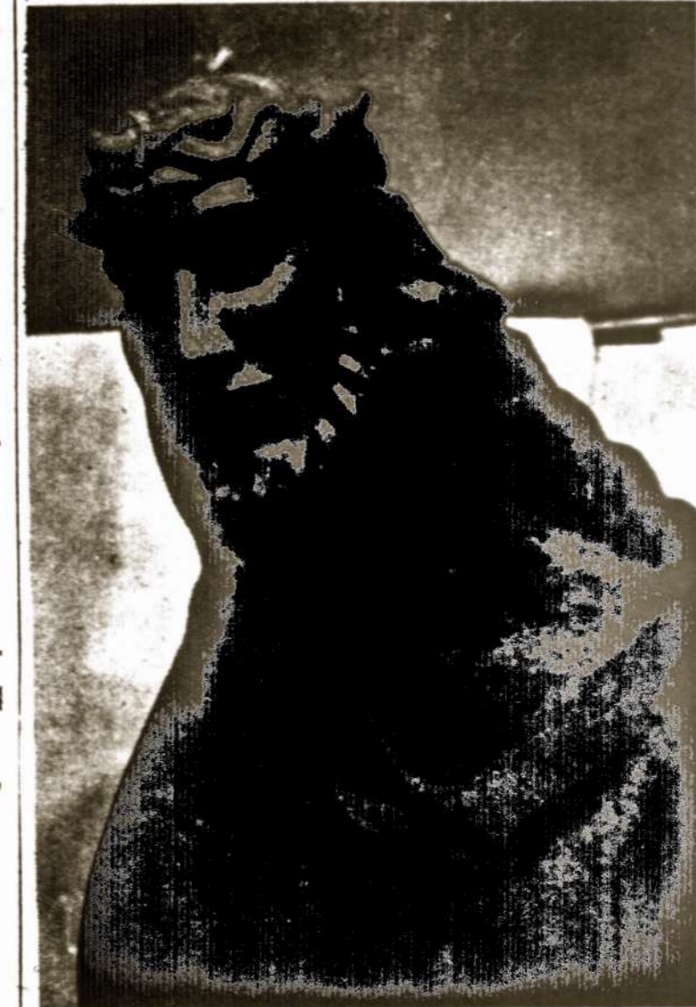
Skulptūra "Kristus" Šv. Kryžiaus bažnyčios fasade, Čikagoje. Darbas dail. J. Šapkaus.