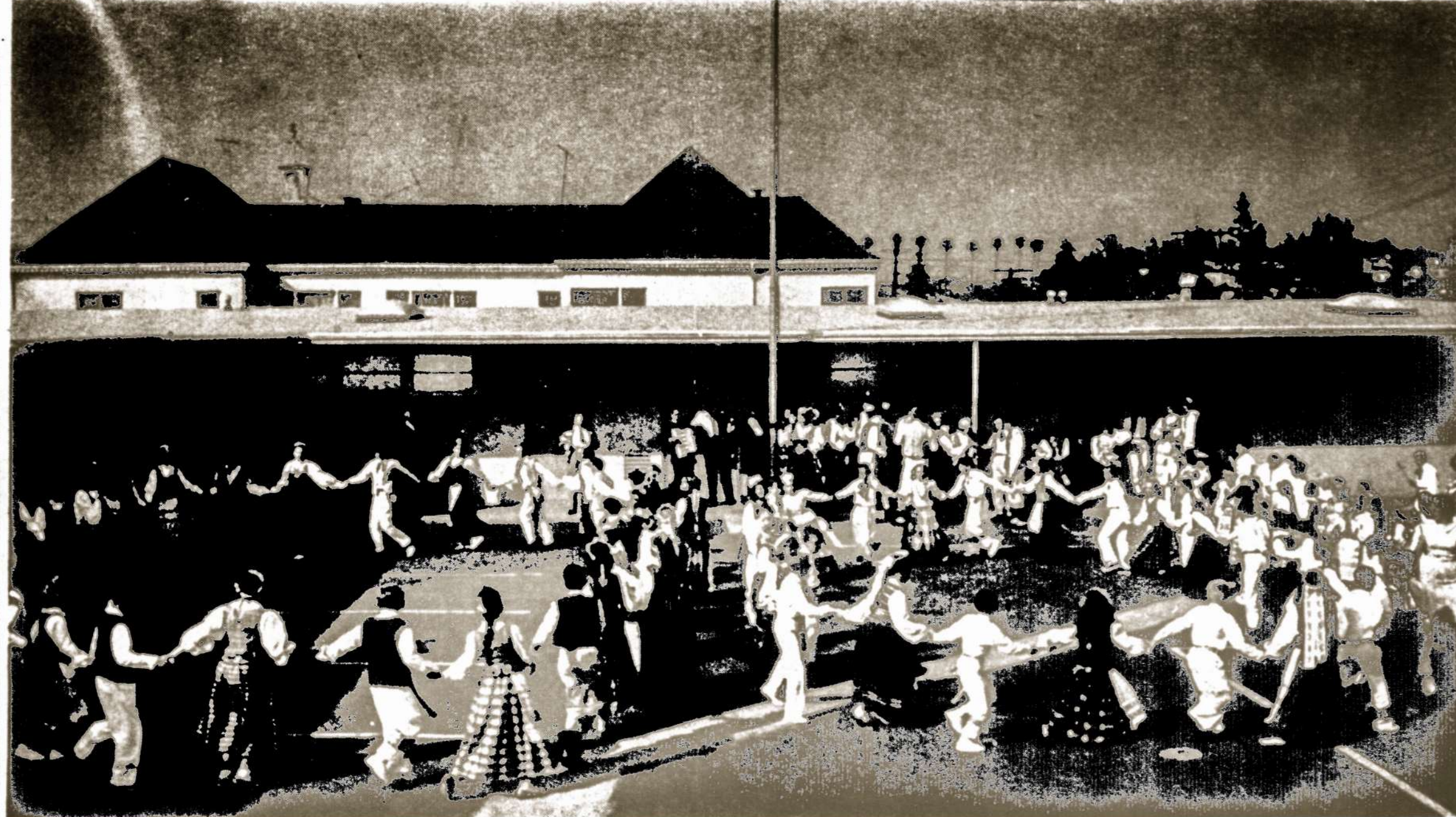
Los Angeles Jaunimo Ansamblis šoka tautinius šokius minėdamas savo 15 metų gyvavimo sukaktį, birželio 7 dieną.