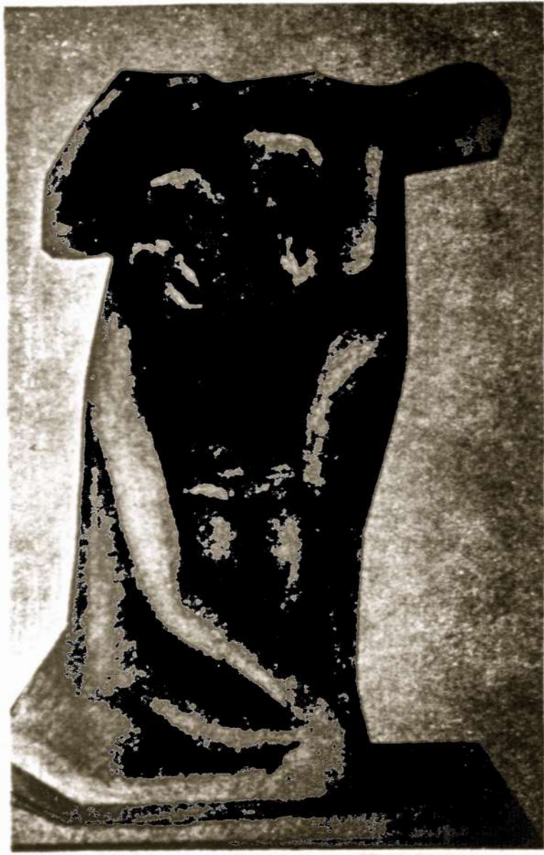
Dail.Šapkaus Skulptūros projekto ški cas.