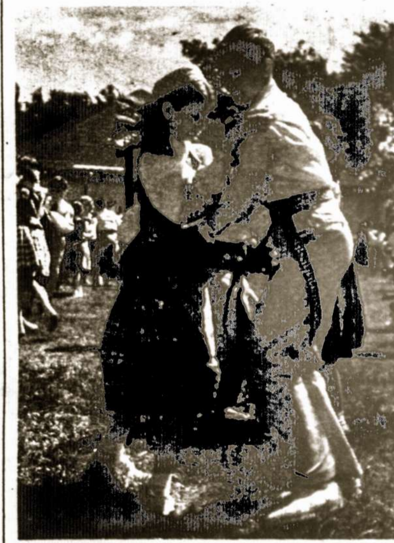
Čikagos moksleivių pavasario šventėje "Dzūkų polka". . .