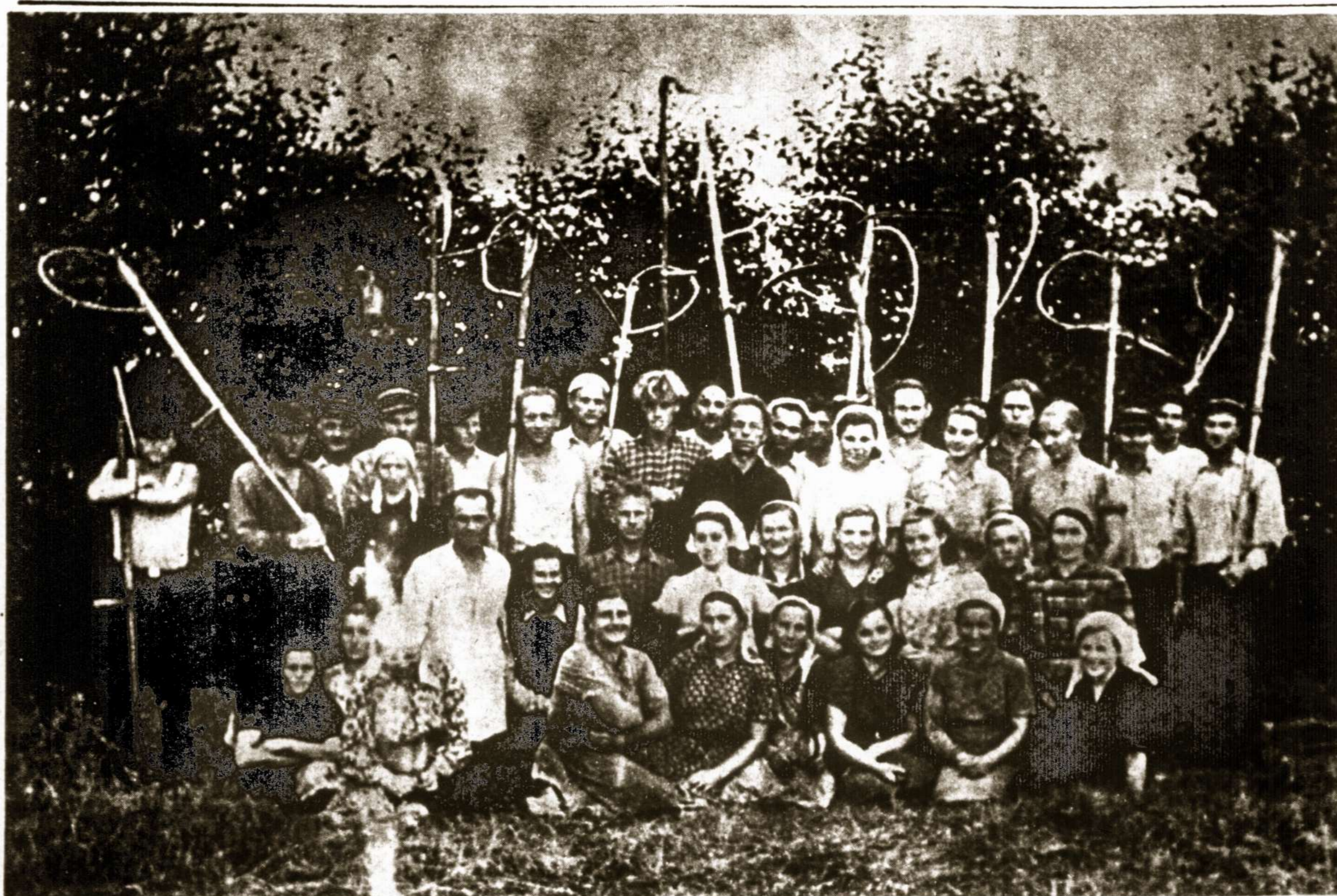
Pavergtos Lietuvos valstybinių dvarų baudžiauninkai aukštai iškėlę okupanto taip reklamuojamą "kombainus" po derliaus nuėmimo... Nuotrauka iš 1963 metų. Pažymėtina, kad šis kolchozas turi apie 2.000 hektarų.