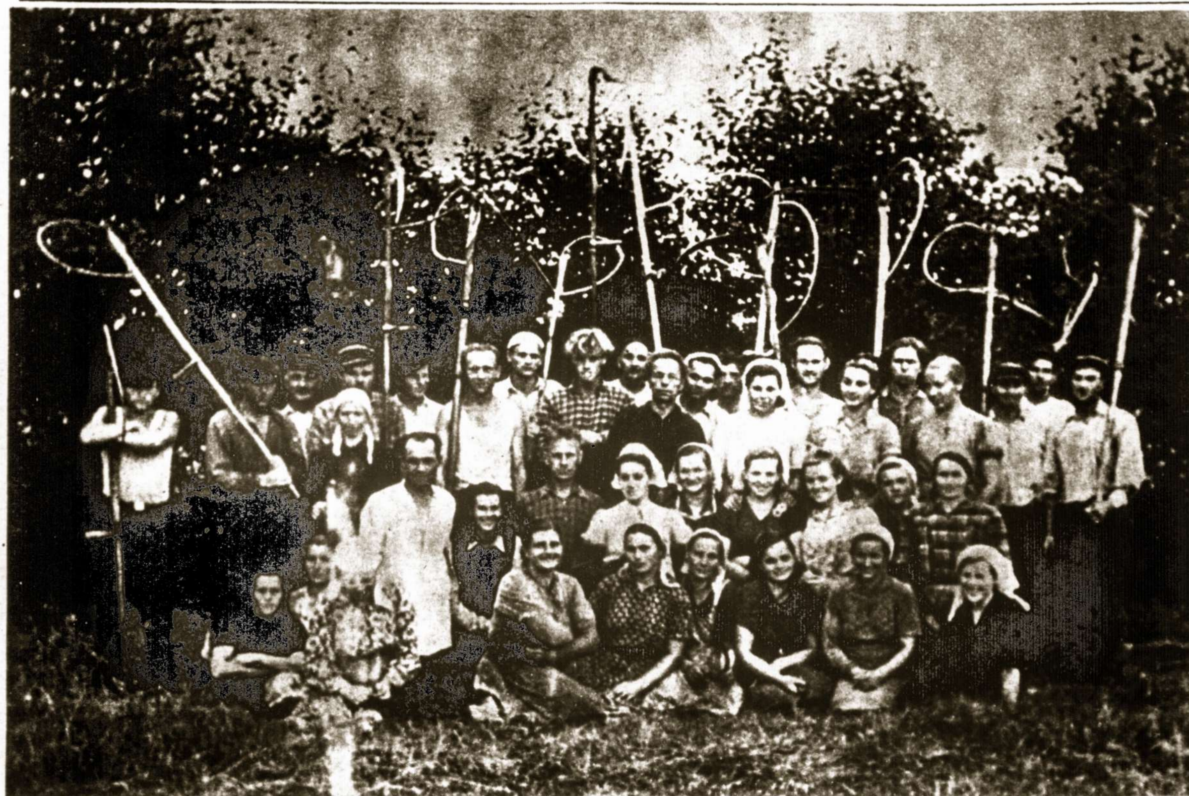
Pavergtos Lietuvos valstybinių dvarų baudžiauninkai aukštai iškėlę okupanto taip reklamuojamus "kombainus" po derliaus nuėmimo... Nuotrauka iš 1963 metų. Pažymėtina, kad šis kolchozas turi apie 2.000 hektarų.