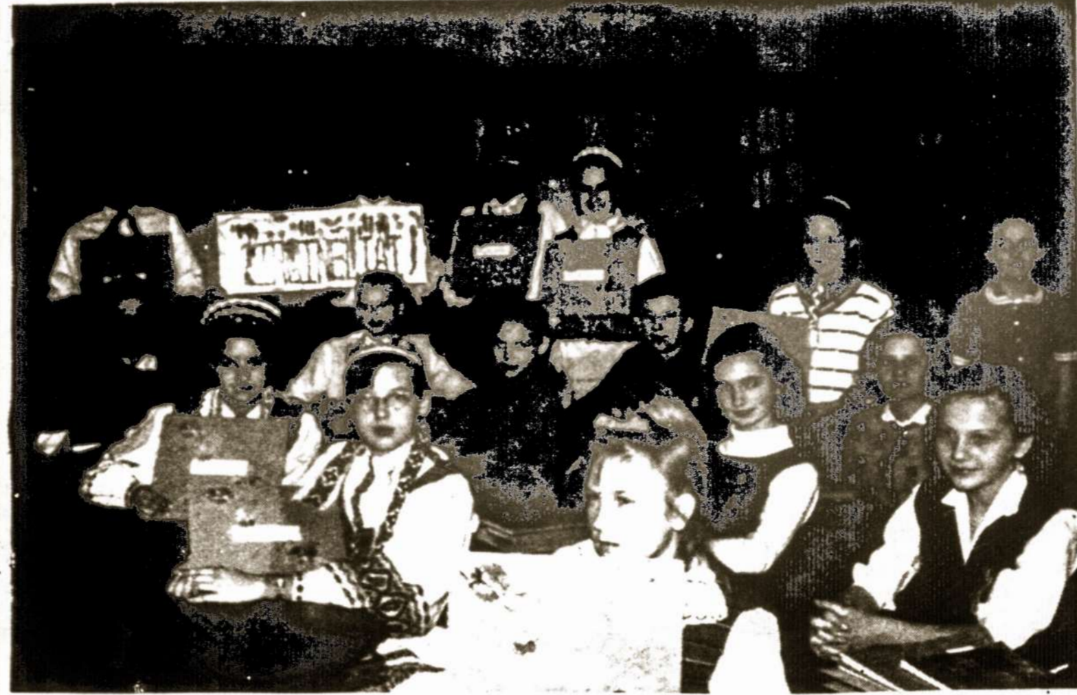
Ir pražydo geltonai Žirginėliai - žirginai... "Žirginėlių" pokštelės klausytojai Čikagos Kristijono Donelaičio mokyklos VI skyriaus mokiniai su savo

Vilniaus Krašto Lietuvos Sąjungos metinis suvažiavimas vyksta Detrote - Lietuvos Namuose -3009 Tilmara St. Suvažiavime dalyvauti kviečiami