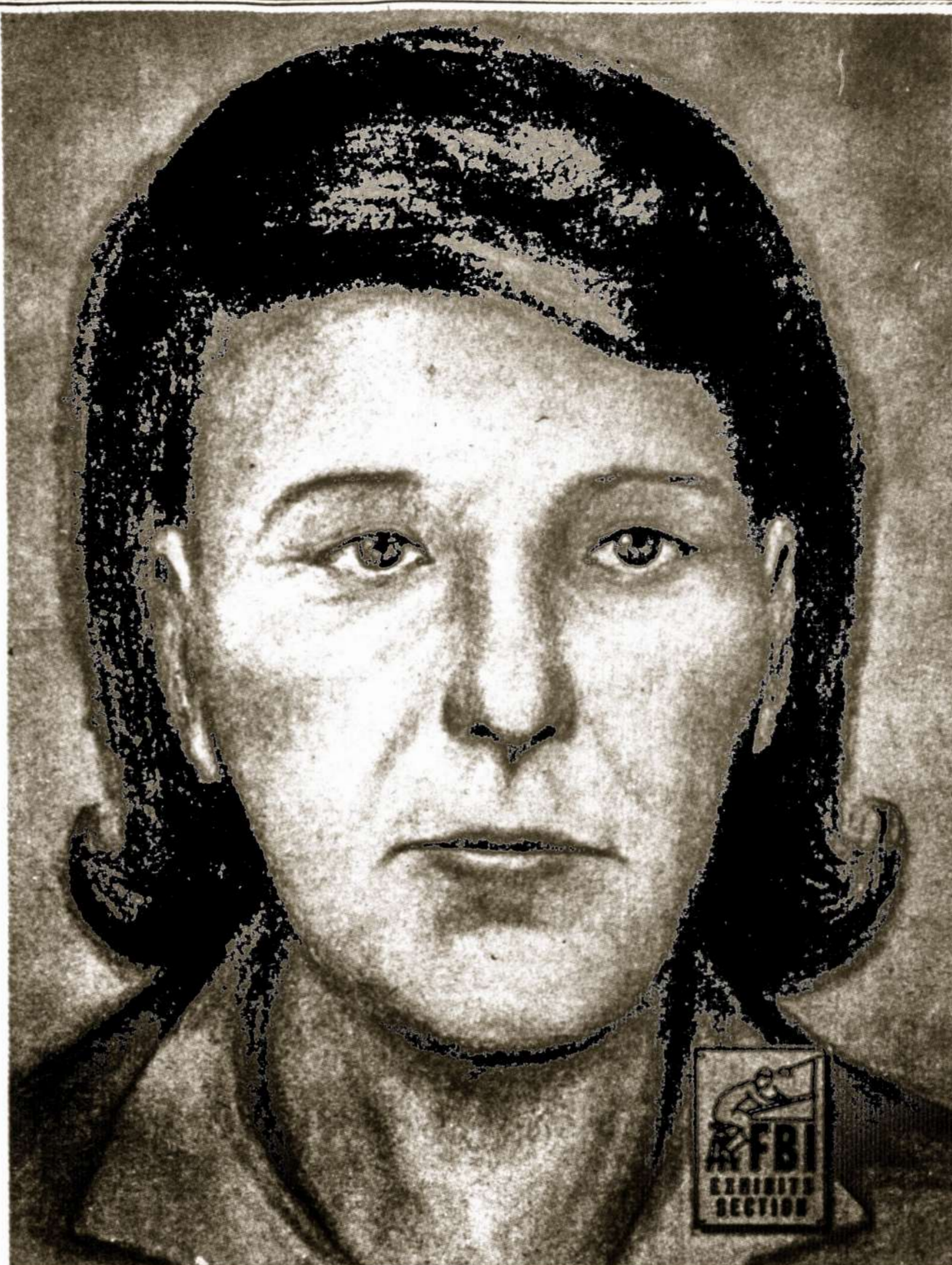
***** AMERIKA KAPITULIUOJA ? Tąsa iš 2 puslapio

Uš jos išaiškinimą ir sulaikymą yra paskirta dešimts tūkstančių atlyginimas. Asmenys, turin- tieji bet kokias informacijas ar įtarimą ir prane- šantieji atitinkamoms įstaigoms, jei pageidaus, bus laikomi paslapyje ir jų pavardės neišduoda- mos.