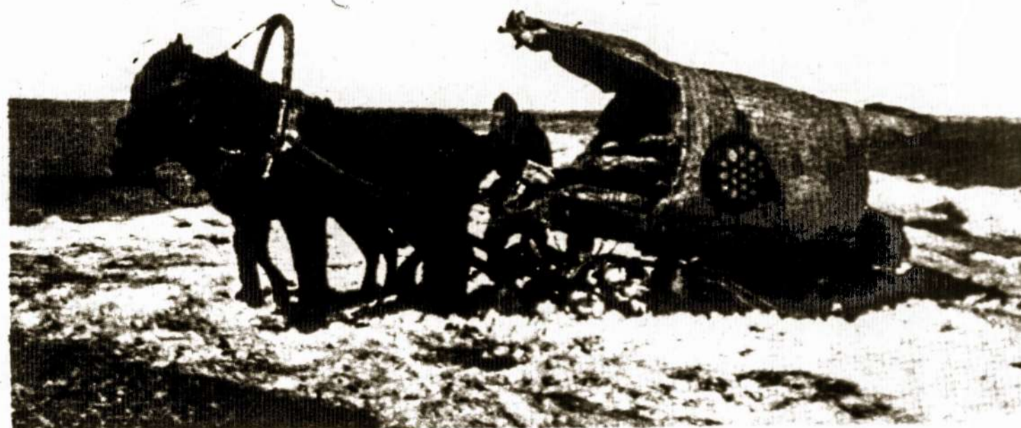
Tai laimingas gyvenimas sovietiniam "rojuje"... Čia visas turtelis tame vežimuke... Nereikia nei garažo, nei gerų kelių, nėra nei rūpesčių kas bus rytoj... Už šį dvidešimtojo amžiaus valstybinį vergą galvoja Kremliaus bosai.