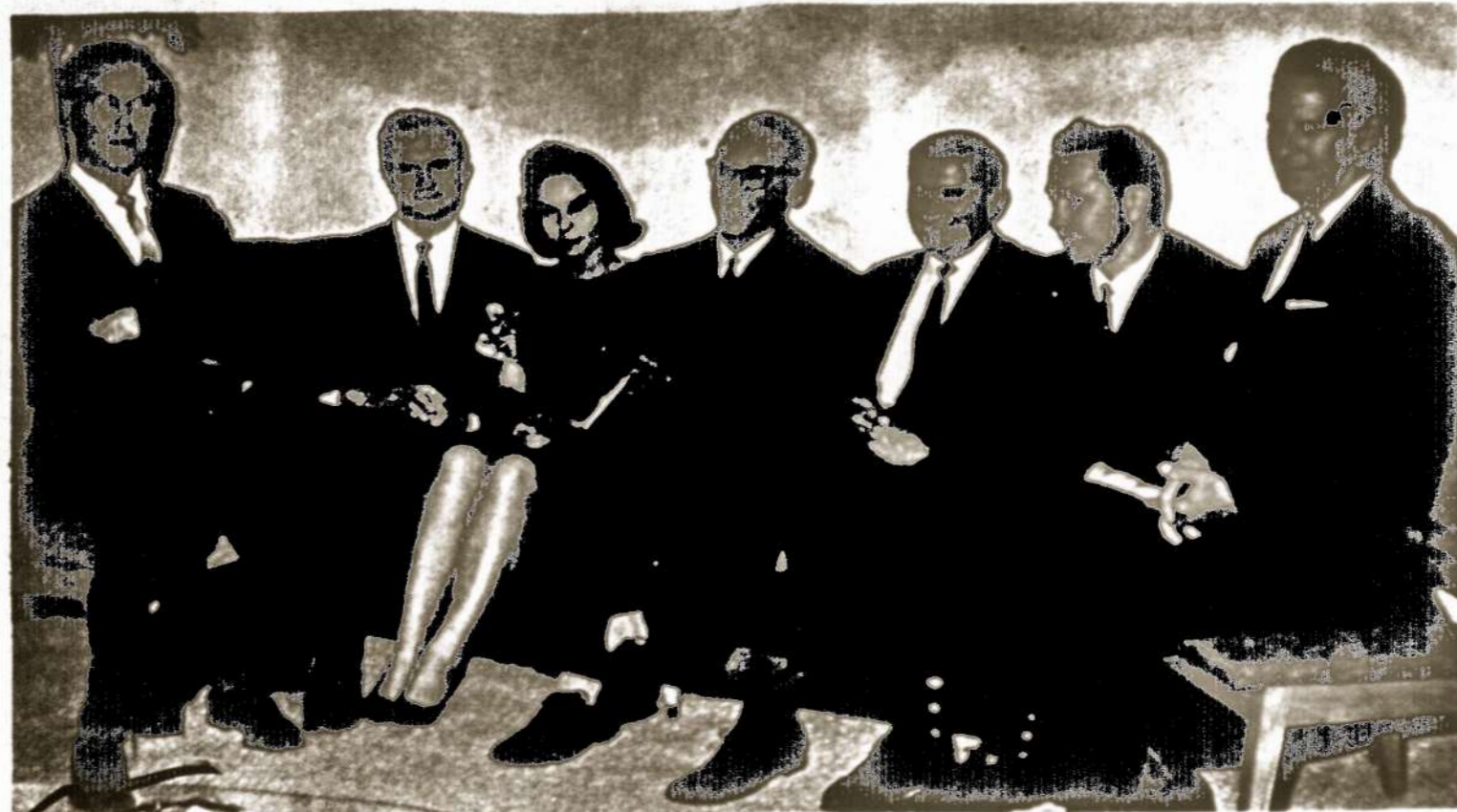
SSSR - Vokietijos nepuolimo sutartis. Darėsi aišku, kad karo pradžia yra labai arti.

Rugpjūčio 23d. žinios buvo tikrai sukrečiančios: Maskvoje pasirašyta