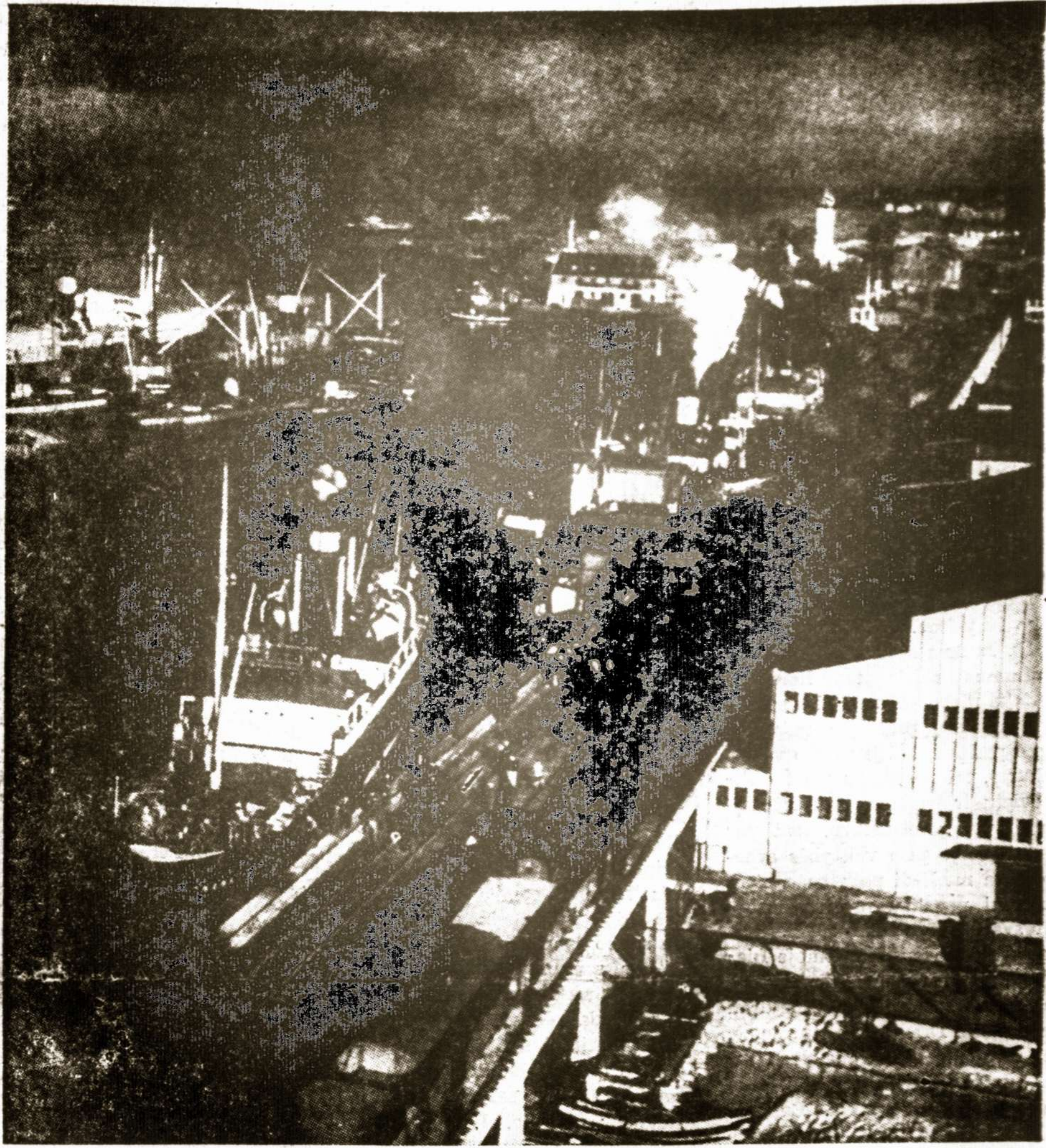
Lietuvos jūrų uostas Klaipėda, dar anais, nepriklausomybės laikais, kai visoks judėjimas vyko su visu pasauliu. Uostas buvo naujai atstatytas ir pirmavo, net Pabalty. — Jis atsikvėpė, įsijungė į Lietuvos valstybinį gyvenimą, lygiai prieš 35 metus. Bet dabar ten raudonasis okupantas, baigia iš šaknų naikinti ir gyvena merdėjimo dienas. O tas ne amžinai!

Liko rymoti žvejas prie marių, Tarytum dobilas pievoj: "Sudie", — nuliudęs ramiai jis / tarė Ir pakartojo: "Sudievu..."