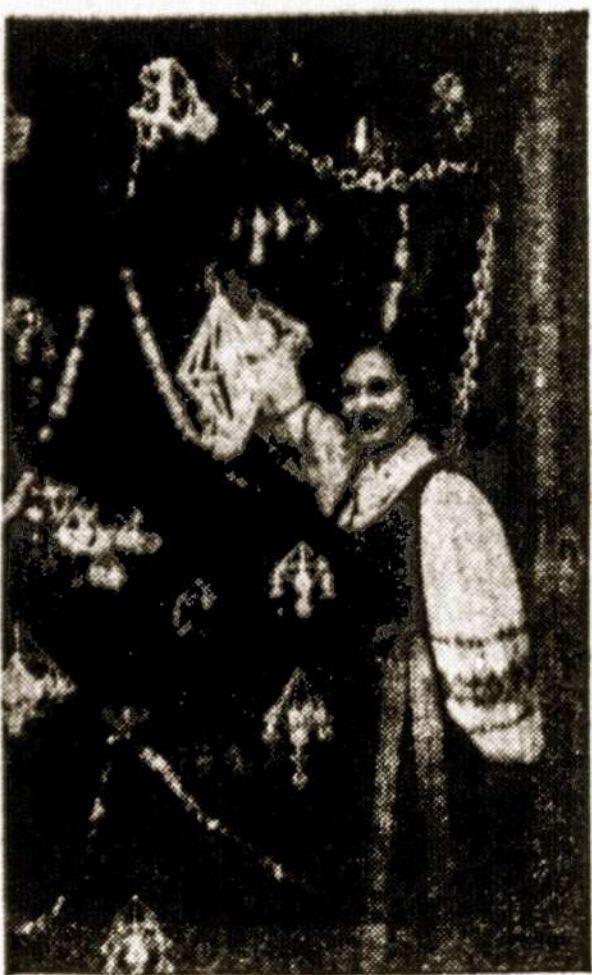
Lietuvių Kalėdų eglutė Mokslo ir Pramonės Muziejų, Čikagoje

Man atrodo, kad iš natūralaus įvykio kuriami labai nenatūralūs dalykai.