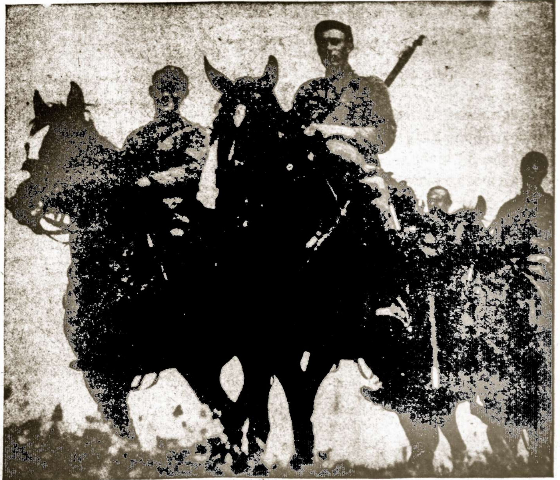
Kavalerijos joja užfrotėj...