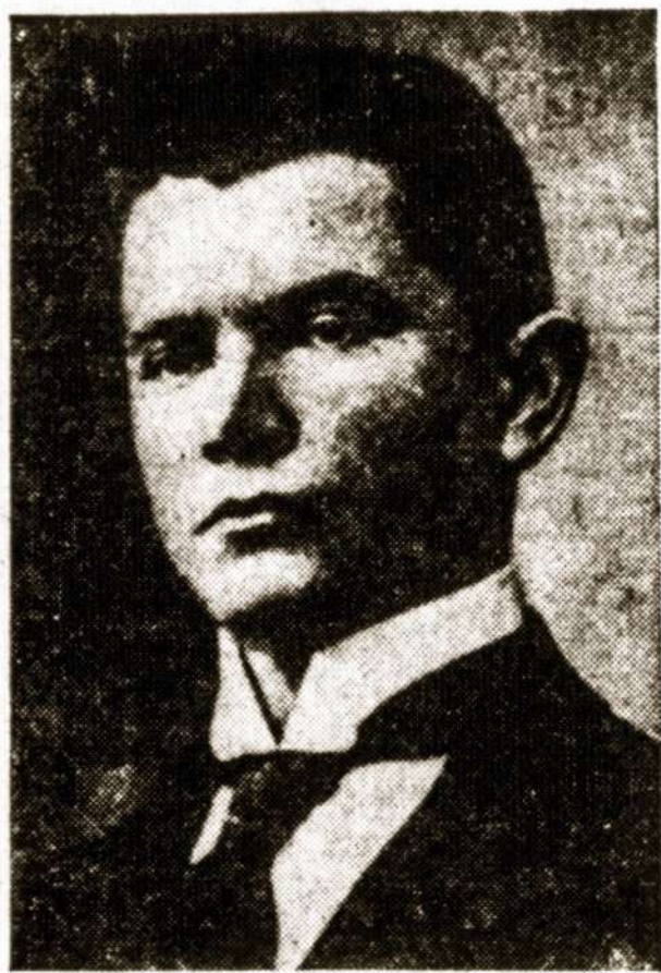
Prof. A. Voldemaras

(3 tęsinys, 30-ties metų sukakties proga)