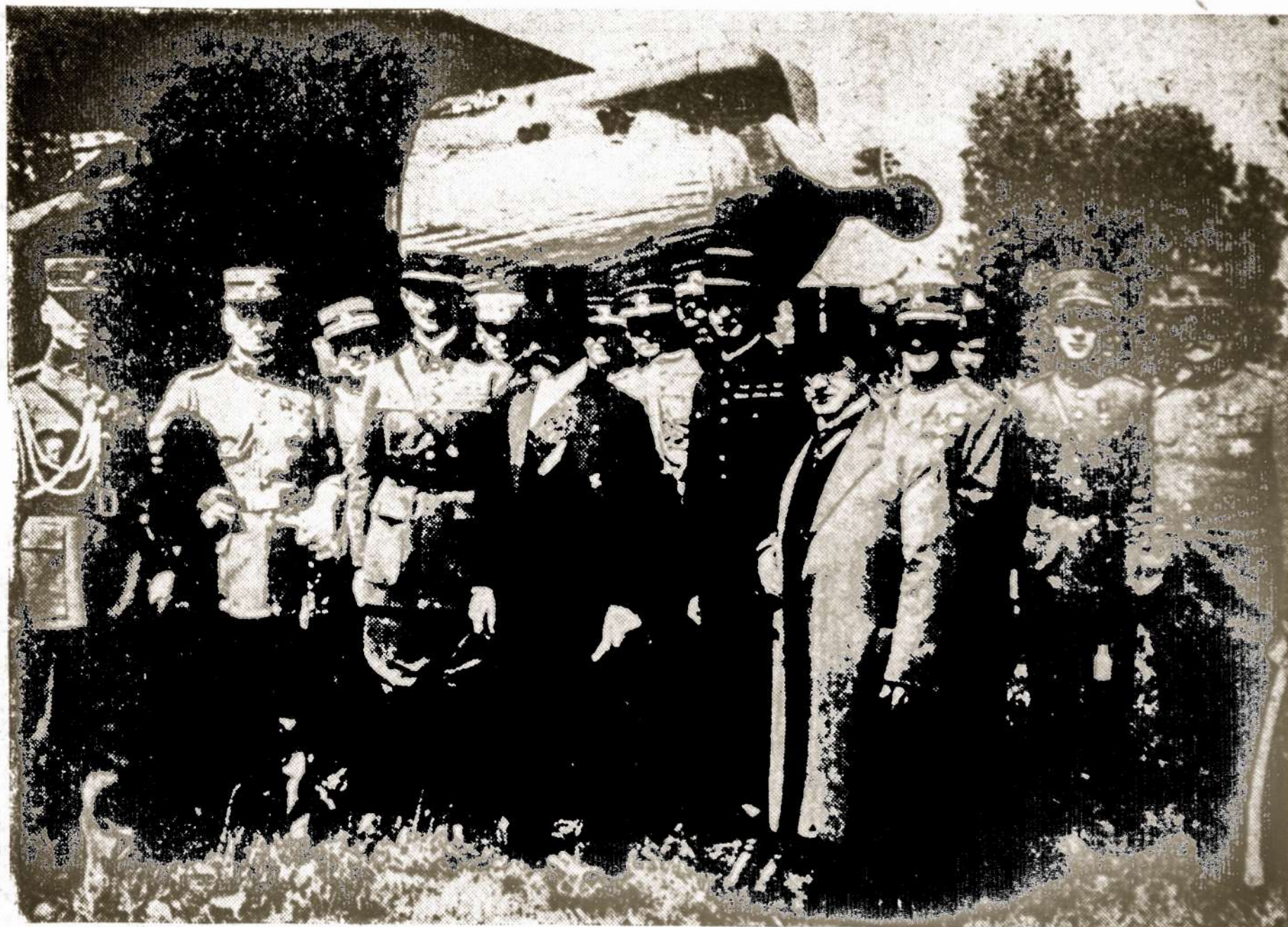
Anais, Nepriklausomos Lietuvos istoriniais laikais

Tokios derybos su lenkais vyko Karaliaučiuje, bet jos neatnešė teigiamų rezultatų. 1928-tų metų vasarą Vilniaus byla iš naujo įsiliepsnojo Tautų Sąjungoje. Lietuvos min. pirm. prof. A. Voldemaras vėl išvyko Ženevon, kur pasakė daug ugningų, pasaulio spaudos dėmesį atkreipusių, kalbų. — Bet Tautų S-ga nepajėgė Vilniaus, lygiau kaip vėliau kitų konfliktų išrišti. Tai buvo nemažas smūgis jos prestižui ir neigiamai atsiliepė į jos tolimesnių likimą.