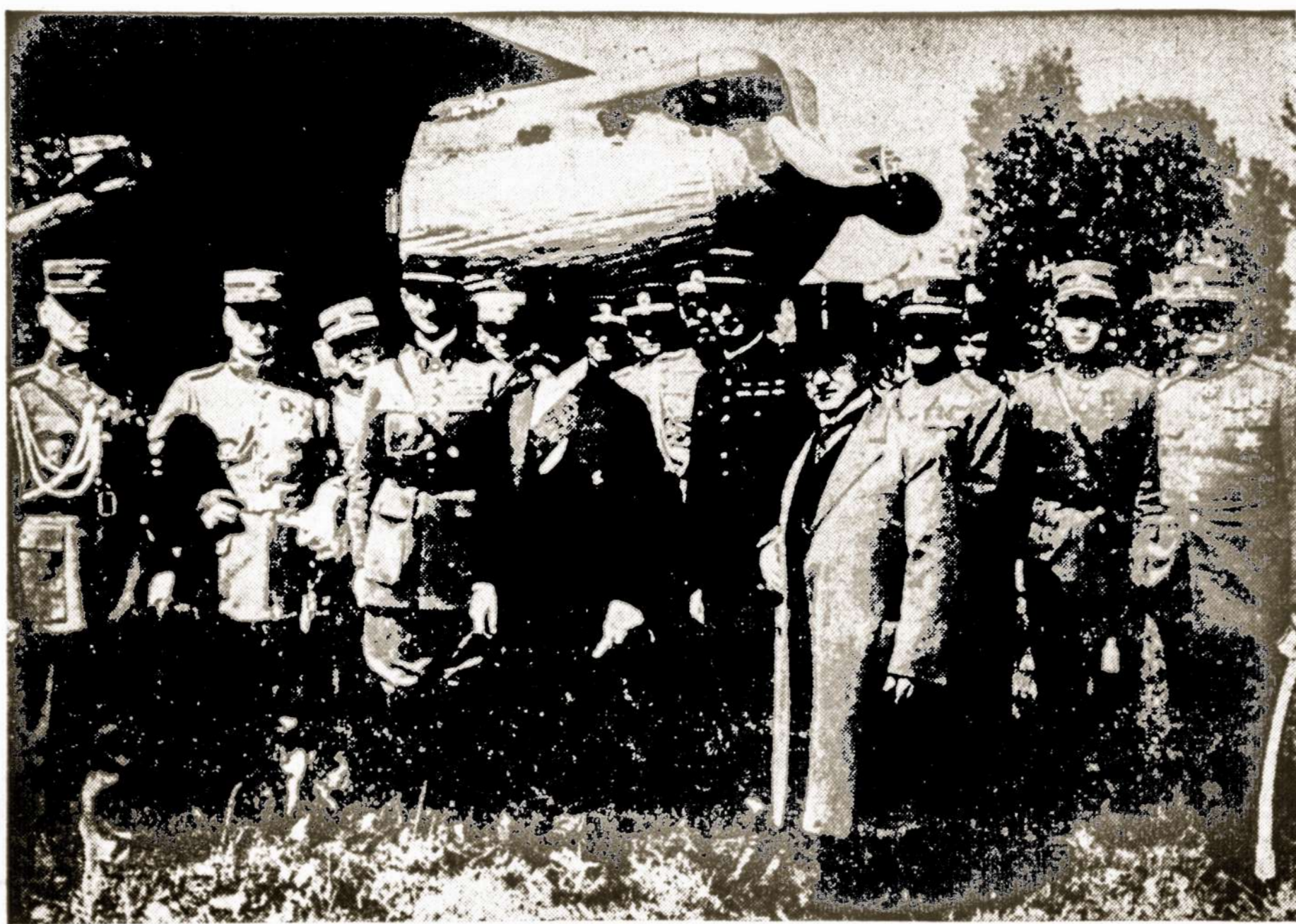
Lietuvos Respublikos Prezidentas Antanas Smetona ir Ministeris pirm. prof. Augustinas Volde-maras, lydimi Lietuvos ir užsienio aukštųjų karininkų, Kauno aerodrome, nepriklausomybės laikais.

Laimėtojai veržėsi iš salės, kad suskubytų ištuštinti iki saulės nusileidimo laimėtuosius gėrimus... O saulė, lyg tyčia, nesulaiko-