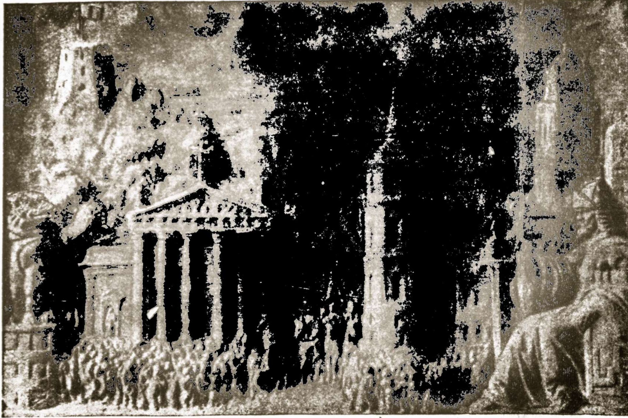
Senasis, istorinis Vilnius

"Entered as second class mat- ter at the post office at Chicago, Illinois."