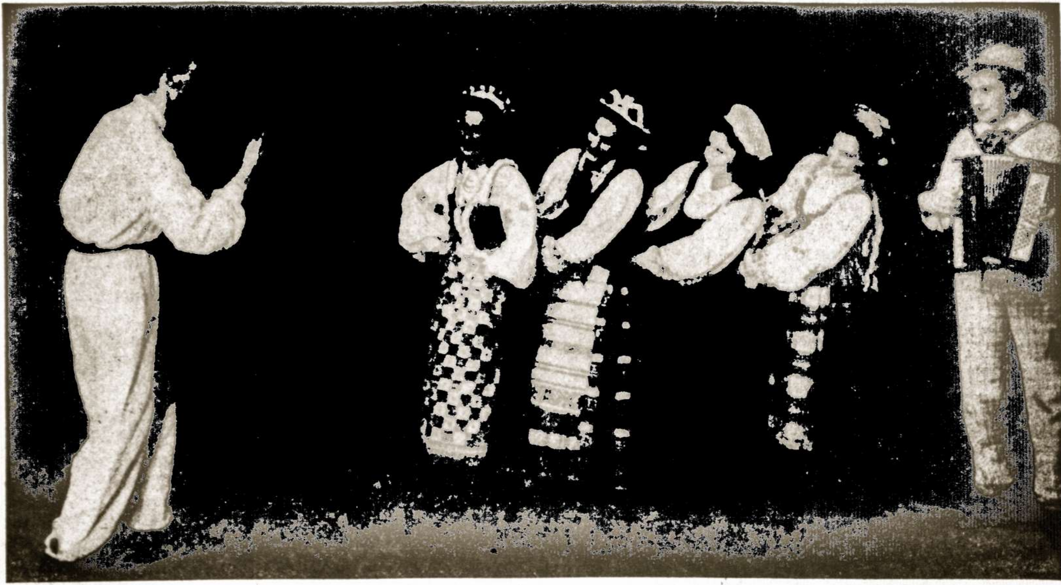
Lenciūgėlis tremties metais Vokietijoje, Tuebingene (Čiurlionnio ansamblio šokėjai).