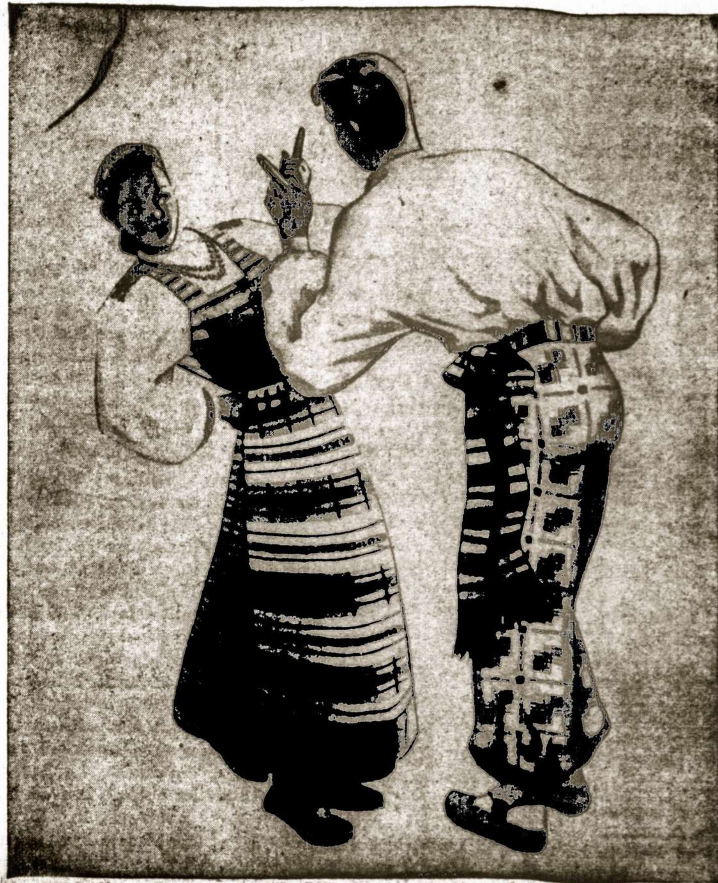
Tautinių šokių šventė čia pat. Viename ritme susilies ne viena pora, o šimtai.

Šiandieną daug kas patenka į komunistinės undinės politikos glėbį.