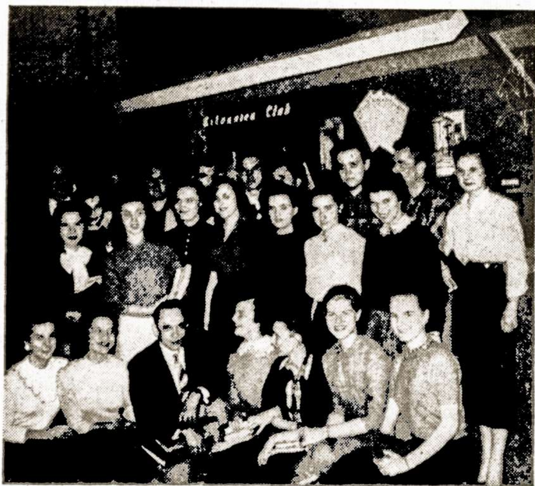
"Lituanicos" klubo, veikiančio Illinois Universitete — Chicagoje, nariai.