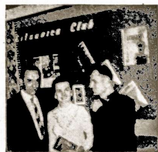
Lietuvių parodėlės rengėjai Illinois Universitete, Čikagoje

Šventės rengėjai yra pakvietę visą rytinio pakraščio jaunimą į šventę ir tikisi, kad jis gausiai jooje atsilankys.