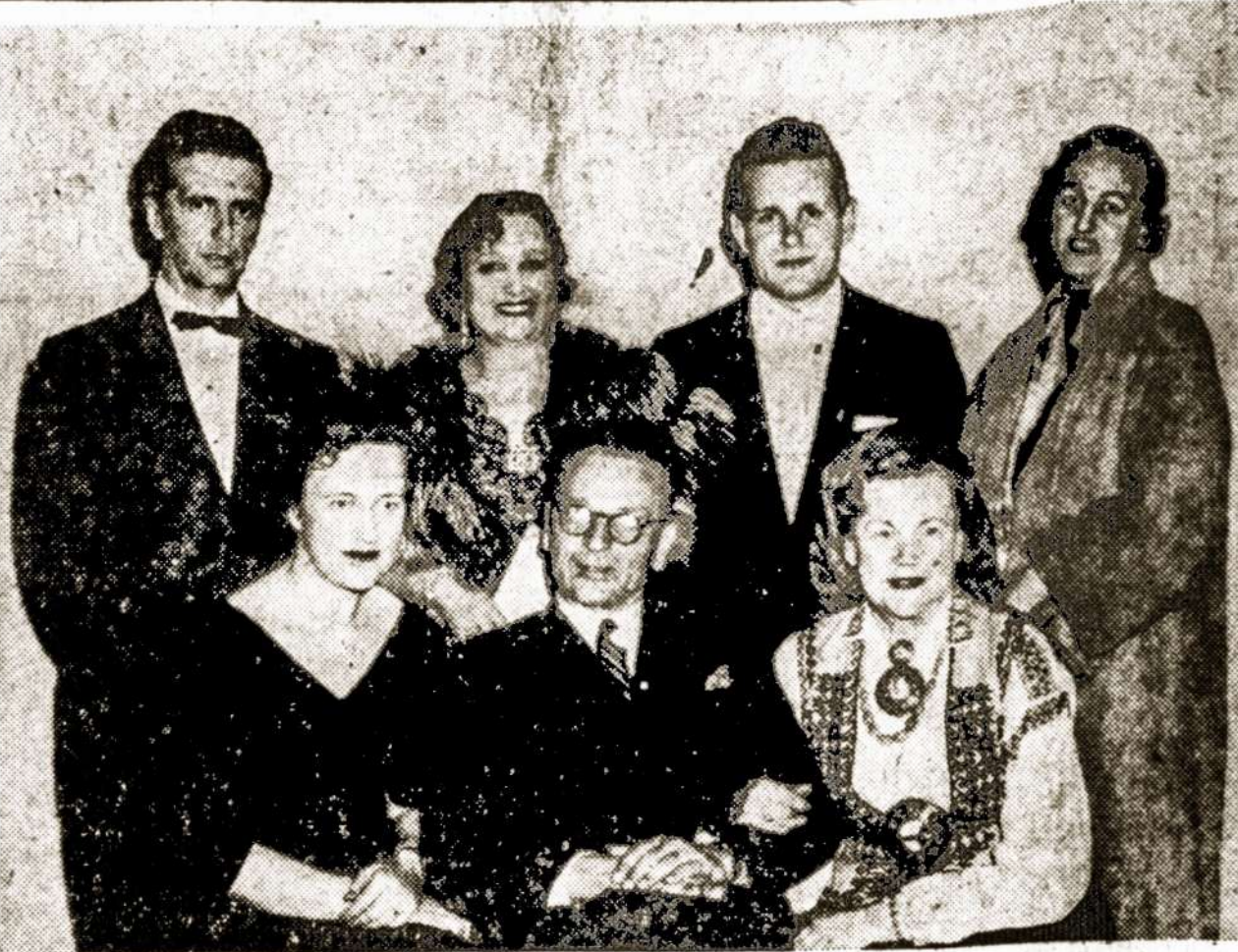
Antikomunistinio Fronto Baltijos tautų komitetas, New-Yorke.

Teoretiniam švietimui ir repeticijomis tinkamų patalpų suradi-