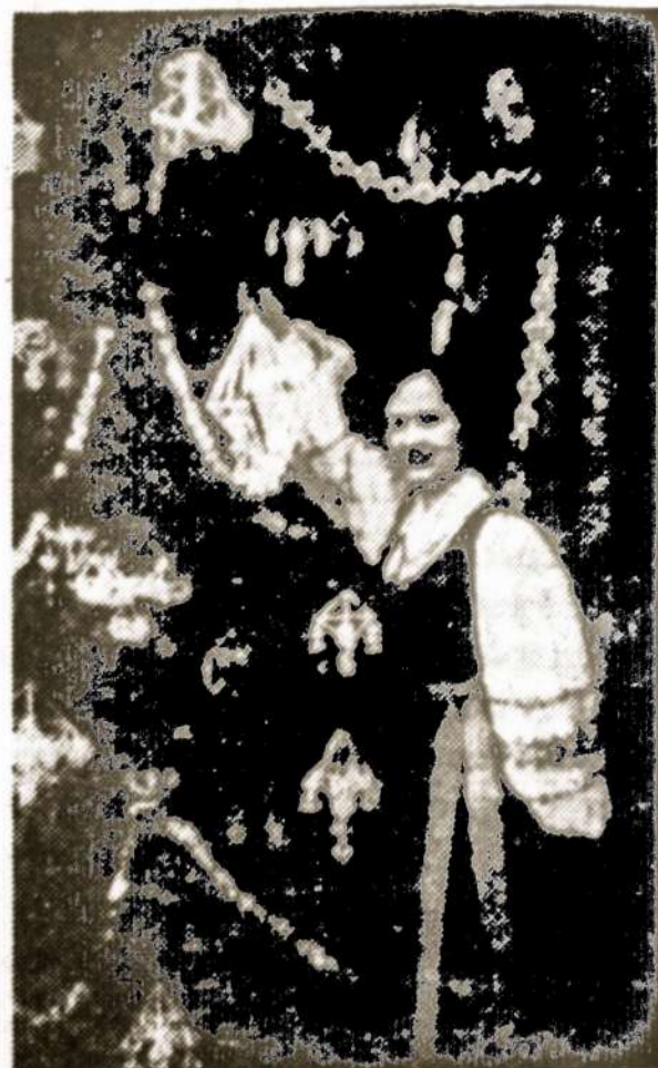
Lietuvių eglutė Prekybos ir Pramonės Muziejuje

"RŪTOS" Ansamblio direktorius ir vadovybė