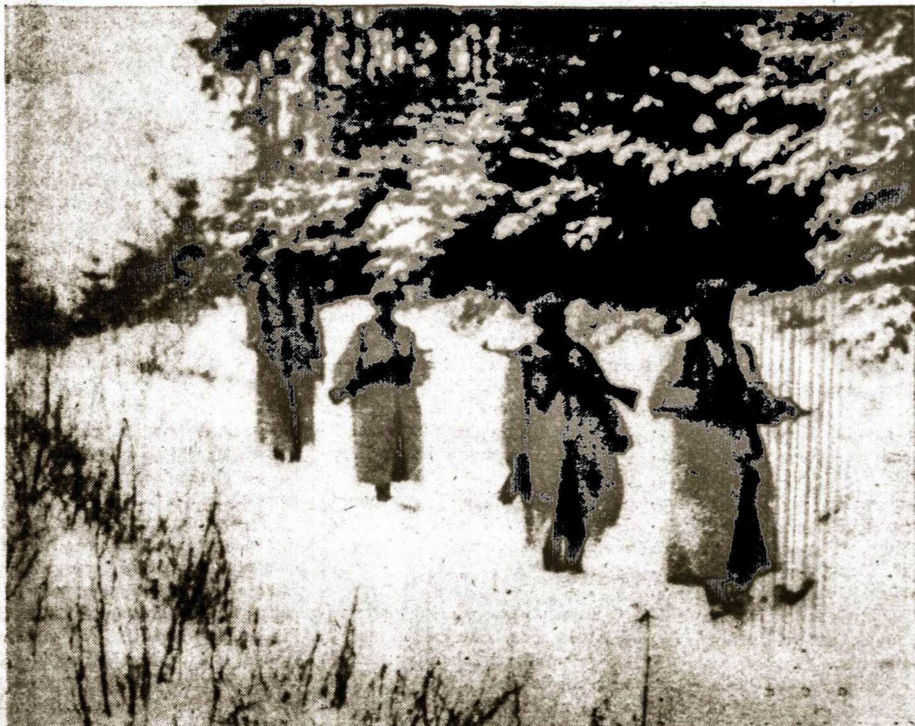
Naujų Metų viltys ir tikėjimas krašto laisve, per sniegus ir šaltį, partizanų veda ateitin.

Atrodo, kad yra atėjęs laikas išsiveržti iš vidujinio trynimosi veiklos, visą išmintį ir jėgas perkeliant į svarbiuosius tarptautines politikos centrus: Vašingtoną ir New Yorką. Šitas darbas turi būti pavestas tiems, kurie supranta dabarties skaudų tragizmą ir jau-čia pilną atsakomybę prieš tautą ir jos ateinančias kartas. Tačiau, vien supratimo ir gerų norų nepakanka: Akcija turi būti efektinga: žodžius turi sekėti darbai.