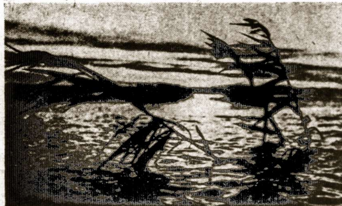
Dusėtų ežeras, Zarasų apskr.

Valstybės. Vašingtone manoma, kad Suez kanalo klausimu anglams ir prancūzams reikėtų padaryti kai kurių nuolaidų ir su Egiptu susitarti, nes karinės jėgos panaudojimas prieš Egiptą sukeltų ant kojų visą arabų pasaulį, kuris galutinai persimestų į Sovietų Rusijos pusę.