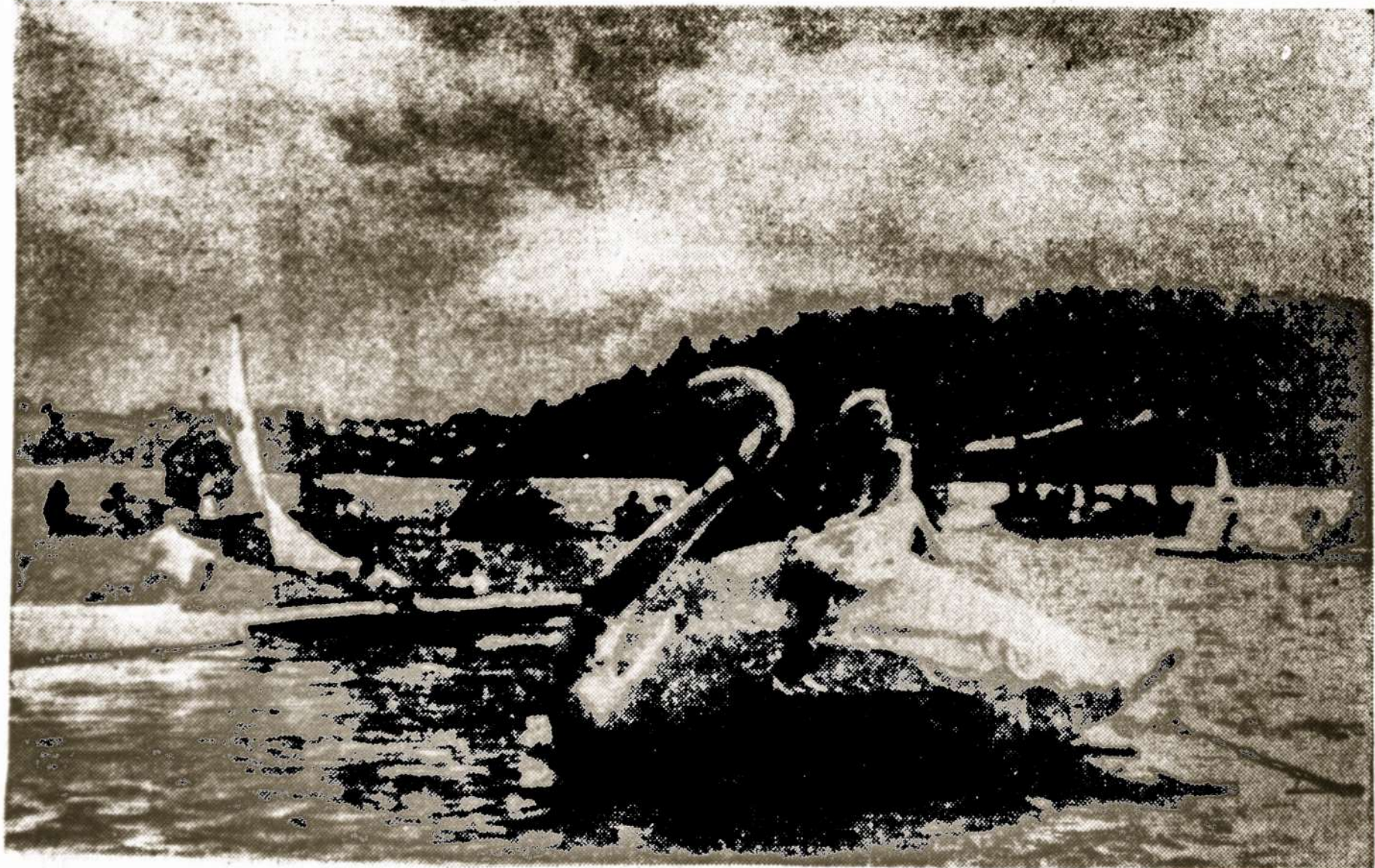
Atsiveikimas su vasara. Dar anais laikais, vasarotojai Zarasuose, ežerų pynėje.

Bus greitai paskelbta, kur galima bus bilietus įsigyti iš anksto.