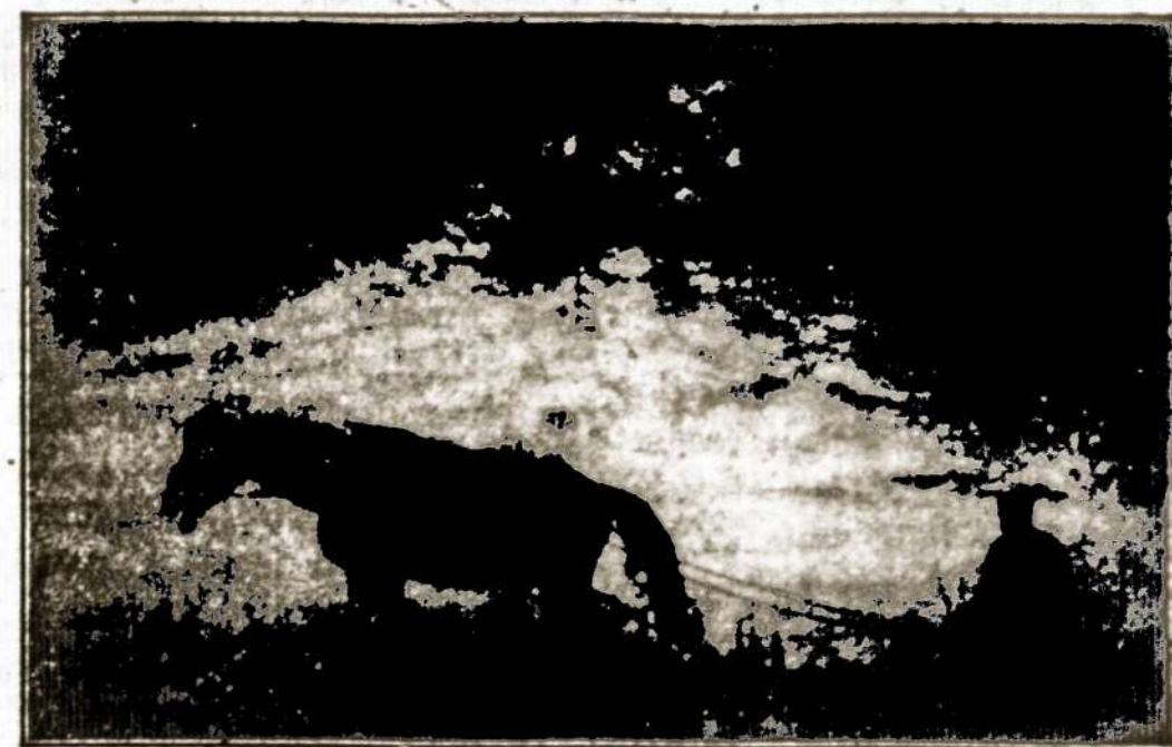
Paskutinę vagą žiemkenčiams...

Reikia daugiau nei stebėtis — Krupavičiaus drąsa, kai jis nus- prendė tuo reikalu kreiptis pas aukščiausius komunistų pareigū- nus: Grosmaną, Gedvilą ir Pa- leckį. O aplinkybės, kuriose jų susitikimas vyko, mus vėrčia per kratyti savo atmintį ir pagalvoti: ar mes daug ką pamiršome... Tais laikais žmonės jau kalbėjo pakuž- domis ir, tai bijodami, kad išgirs kam nereikia. Kai bolševikų de- magogai šlovino Raudonąją armi- ją ir komunistų partiją, jie kiek- vienoj neiškeltaj kumšty matė —