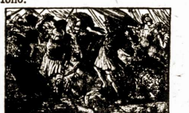
"DEŠIMTIES TŪKSTANČIŲ ŽYGIS".

Sausio mėn. KARYS pradėjo spausdinti graikų klasiko Ksenofono: