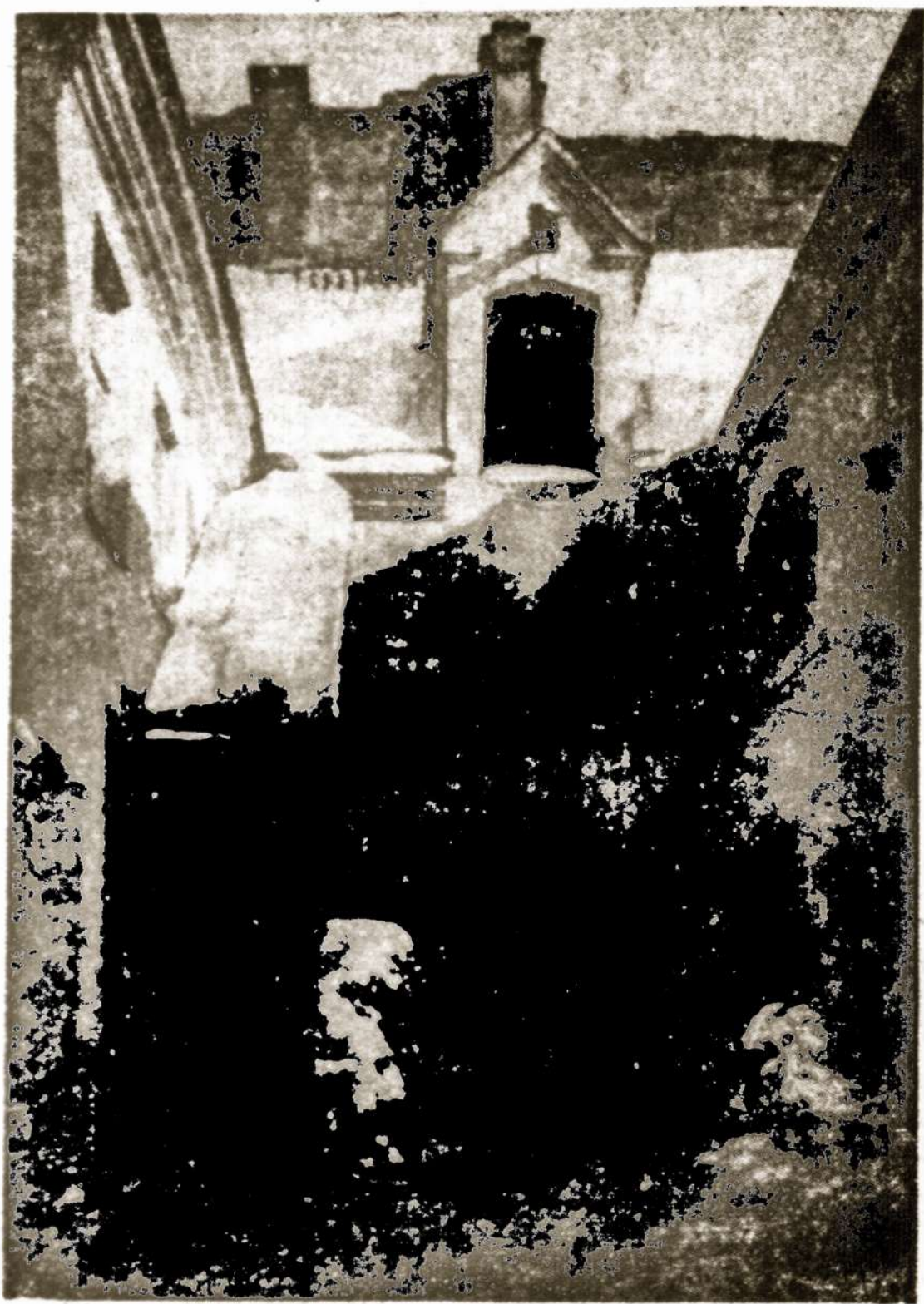
Senjojo Vilniaus miesto būdinga gatvelė