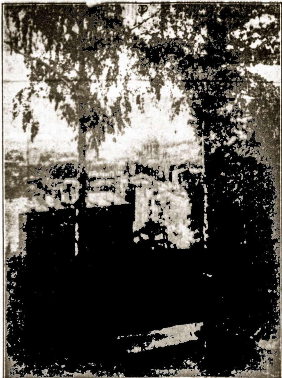
Kaunas iš Vytauto kalno