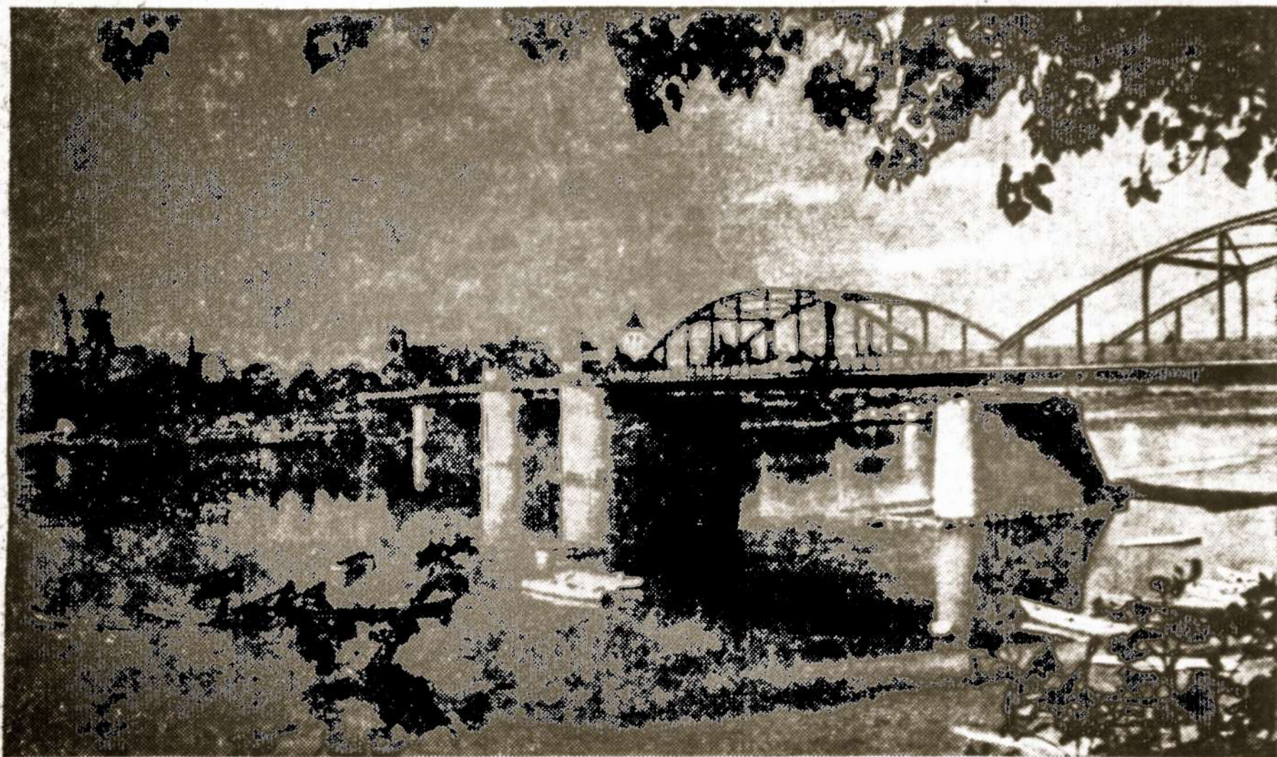
Vytauto Didžiojo tiltas per Nemuną, ties Kaunu. Kaštavo apie tris milijonus litų. Bolševikai, 1941 m., traukdami iš tiltą susprogdino.