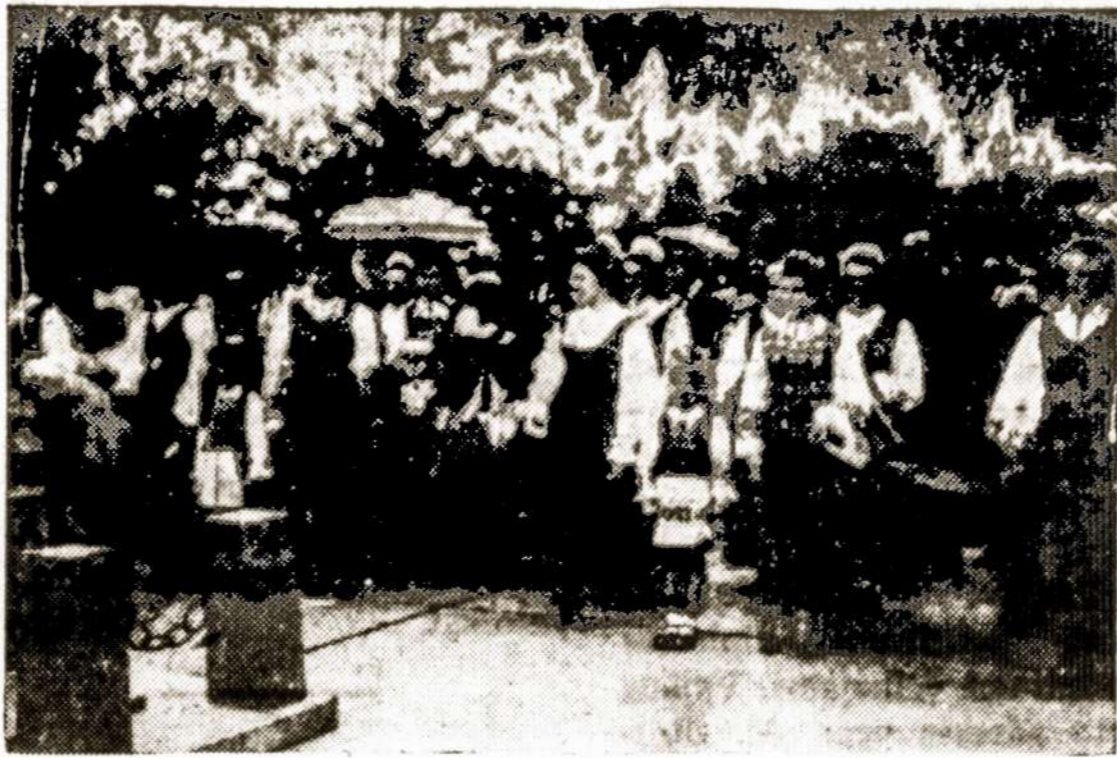
Lietuviai Venecueloje, lietuvių tautos šventėje