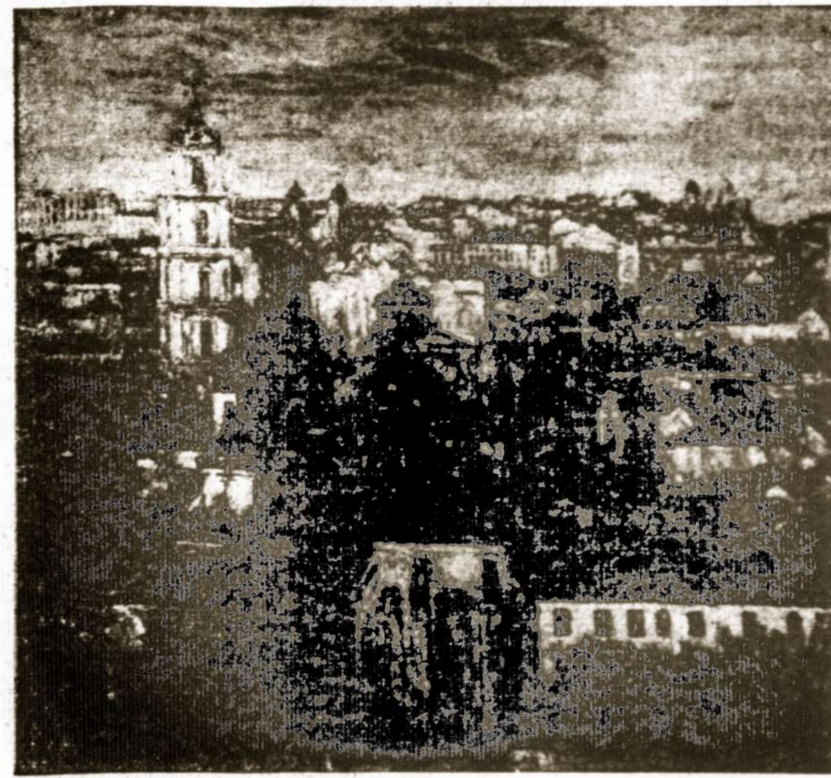
"Antai ir Vilnius ant kalvos, graži sostinė Lietuvos..." Maironis

Minėti bombonešiai bus gaminami dviejuose fabrikuose: Sealt, Wash. ir Whichita, Kans. Nu-