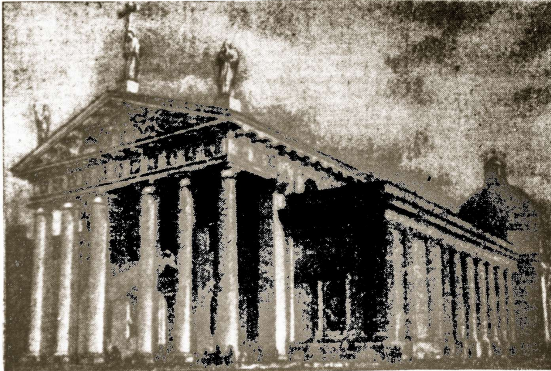
Vienas gražiausių paminklų — Vilniaus katedra, kurioje komunistai daug ką sunaikino.