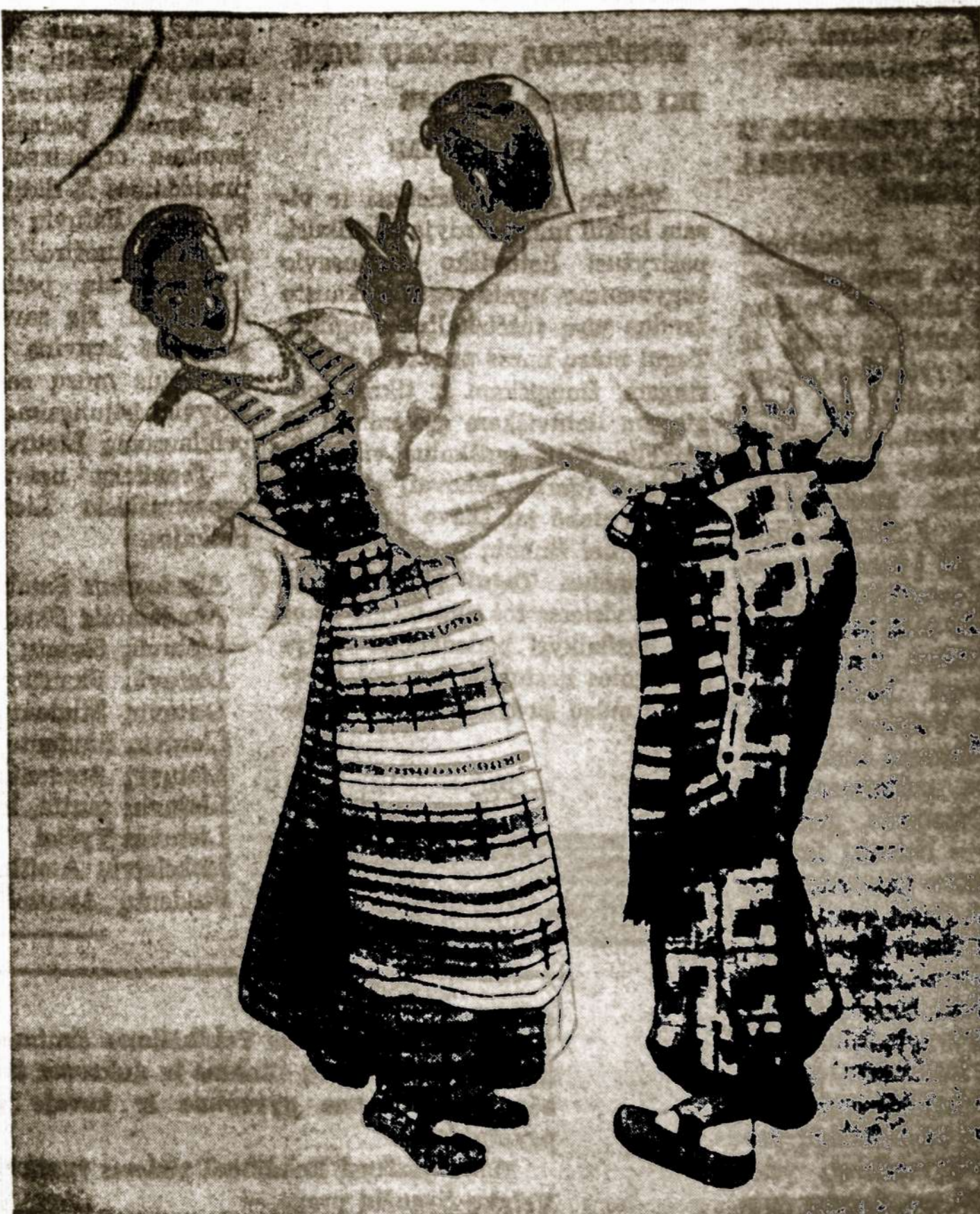
"Ateities" šokėjai, balandžio 15 dieną mini savo veiklos penkioliktmetį.

pastulė JAV bendruomenės valdybai prie jos parengimo prisidėti ir ją paversti JAV bei Kanados lietuvių susitarinimo švente. — JAV bendruomenės vadība pasiūlymų pritarė ir tariamasi dėl bendros šventės programos.