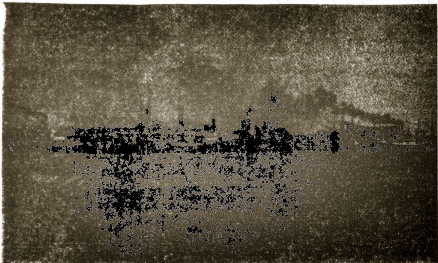
1956 metais sausio 15 d. sukanka 33 metai nuo sukilimo Klaipėdoje. Prisijungusi prie Lietuvos Klaipėda ir jos uostas išaugo dvigubai.