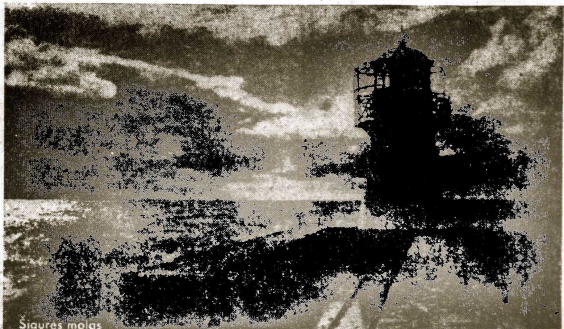
Klaipėda yra Lietuvos langas ne tik į Baltijos jūrą, bet ir natūralus ryšys su Vakarų pasauliu, į kurį yra sudėtos visos mūsų viltys ir pagalbos lūkesčiai.

Pavergtieji kraštai sunkiai iš- gyveno Amerikos politikos susvy- ravimą Jungtinėse Tautose. Ame- rika ligi šiol gynė principus, bet paskutinėj Jungtinių Tautų sesi- joj Amerika pasirinko patogumą. Amerika sutiko įleisti į Jungti- nes Tautas 4 Europos komunisti- nius kraštus, nors ir gerai žinoda- ma, jog tuose kraštuose nėra lais- vės ir žmoniškumo, kurį atstovau- ja Jungtinės Tautos. Amerika tylėjimu buvo sutikusi į JT įsi- leisti ir sovietų kontroliuojamą iš- orinę Mongoliją, bet jos įvedimą sutrukdė nacionalistinės Kinijos veto. Pasidavimas patogumui bau- gai ir pamiršimas skelbtųjų prin- cipų yra juodas ženklas, jog tuo keliu gali būti einama ir toliau. O tai reikėtų, jog jau netolimoje atei- tyje komunistinė Kinija gali atsi- sėsti prie Jungtinių Tautų stalo. Sovietai visap stengiasi įplietinti tai, ką jie turi ir valdo. Tas dar- bas 1955 metais jiems gerai sekė- si. Amerikos susvyravimas tarp principų ir patogumų yra pavojin- gas dalykas visiems pavergtie- siems.