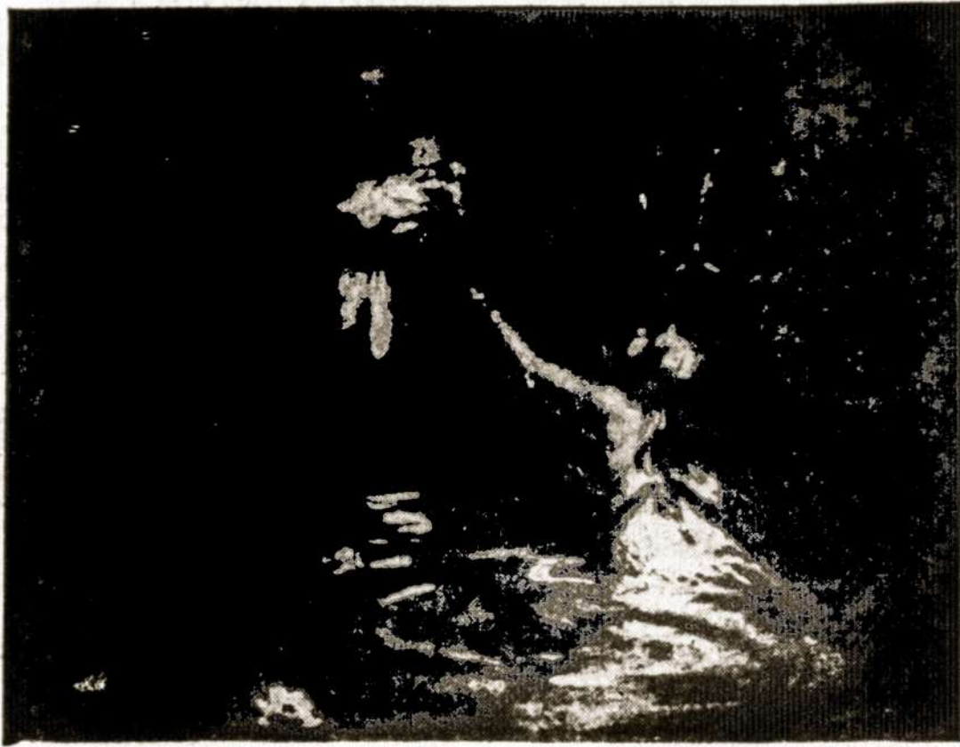
Iš Adomo Mickevičiaus baladės "Žuvytė" — Joninėse