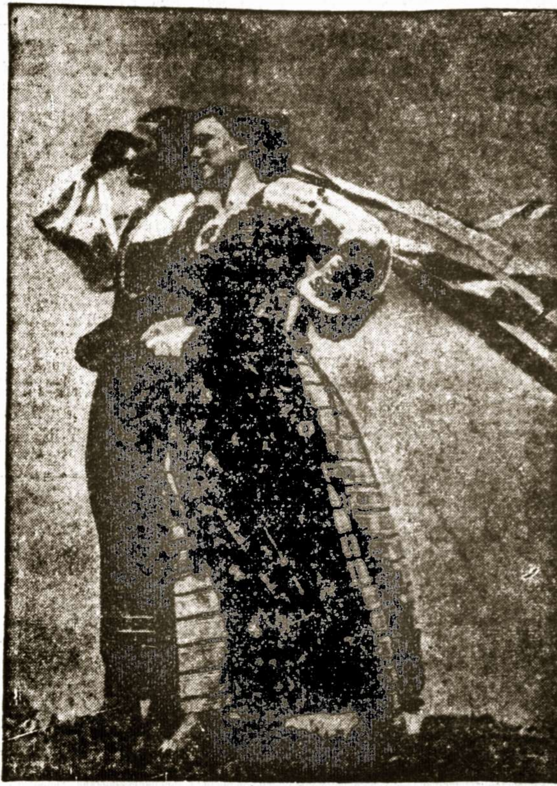
Lietuvaitės laisvajam Lietuvos pajūryje

Pasikaustė bevykdydami vieną iš daugelio operacijų punktų, norėdami antikomunistus pakaustyti, patys pasikaustė. Paaiškėję operatoriai visai nėra pavojingi.