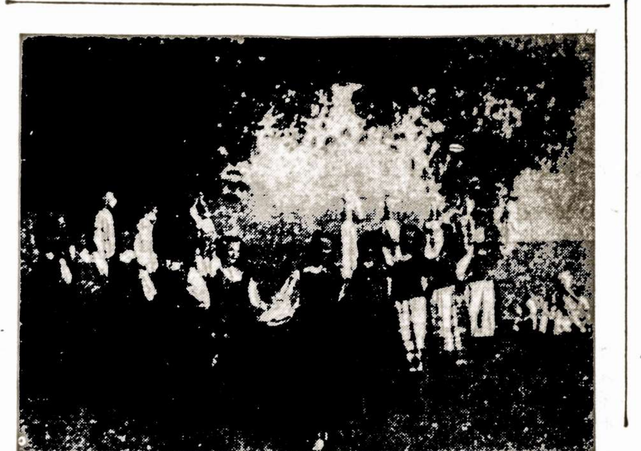
Grazios, grazios merguzelės — plezda, skrenda blezdingelės...

Gal dar mes nebuvo taip tirš tai savo kraštą apgyvenę, kad bū- ti reikėję emigraciją skatinti, kaip darė kai kurios tautos, bet jei dabar tautos nelaimė išbloskė mū- sų didelį būrį, bus natūralu ir naudinga, jei dalis negriš. Ne- reikia dėl to niekam lieti ašarų ir manyti, kad be mūsų sugrius žemė ir dangus. Nesugrius! Lietu- va dėl to neišmirs. Ji yra ir bus sveikas daigynas laisvės sąlygose gimdyti ir auginti sveikai tautai. Tik duokime jai pakankamai sa- vo žemėje vietos. Tik padėkime kovoti laisvės kovą, neišžadėki- me jos. Jei išžadėtume, tada tai būtų nuodemė! Tada tai būtume išgamos! O padėdami saviesiems, liksime savais, nors pats velnias mus ir ant mėnulio nuneštų!